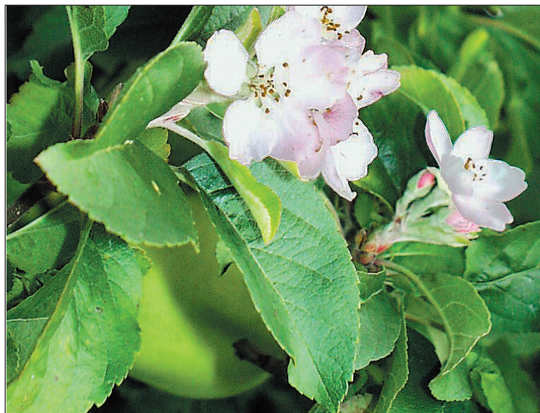
Laune der Natur