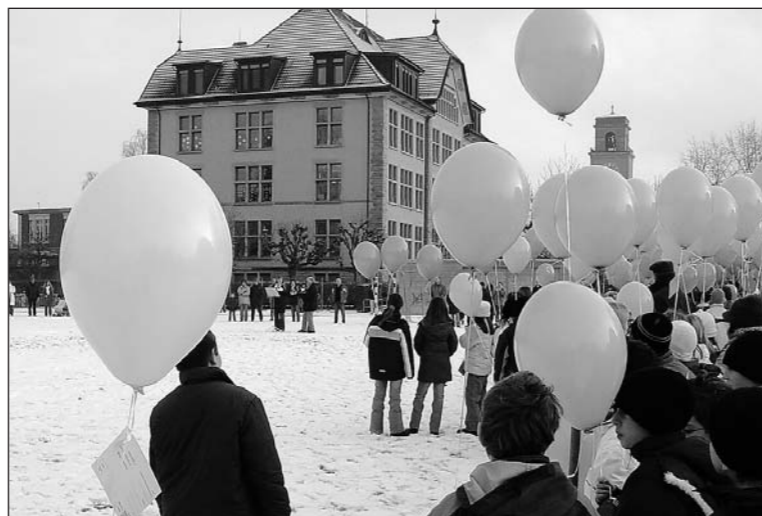
Zum Auftakt des Jubiläumsjahres «100 Jahre Bergli-Schulhaus» konnten die Schülerinnen und Schüler ihre Wünsche für ihr Schulhaus an Ballonen befestigt in alle Welt versenden.

Schulklasse Scheier, Handball HC Arbon, Beach-Handball Smits / Simon, Segeln Gubser/Gubser, Kanu Senioren FC Arbon 05, Fussball