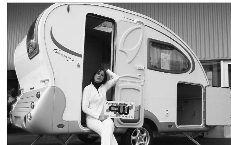
Das «Adria»-Modell «Action» – elegant und überaus praktisch, bestückt mit zahlreichen Neuheiten und Innovationen.

Ebenfalls ins Sortiment von komfortablen Ferien auf Rädern für zwei Personen passt der neue «Action» der Marke Adria. Daneben präsen-