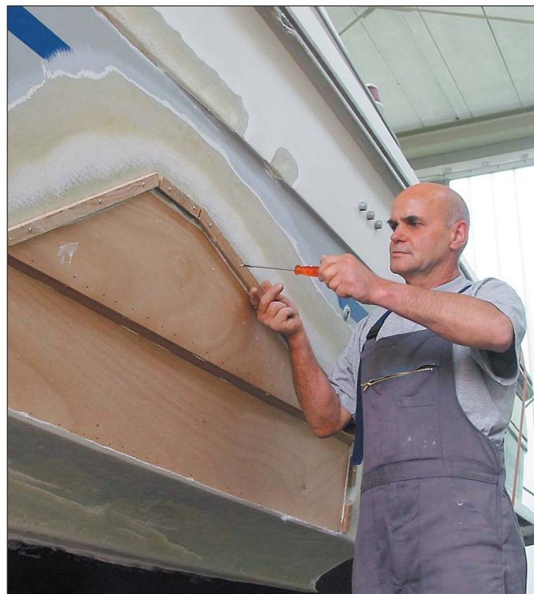
Reparatur – fachmännische Reparaturen aller Art, verschiedene Materialien im Einsatz. Auch mit Kunststoff wird gearbeitet.

Die Yachtwerft Wirz AG hat ab sofort den Schweizer Vertrieb der exklusiven G-Force X-Treme 37-Rennyachten aus Südafrika übernommen. Diese 11.30 Meter langen und 3.48 Meter breiten High-Tech-Segelyachten werden nach allerneuesten Technologien komplett aus Carbon-Fasern erstellt und mit Epox-Harzen laminiert, um mit möglichst wenig Gewicht ein Maximum an Stärke und Verwindungsfreiheit zu erlangen, damit diese Rümpfe die enormen Kräfte und Drucklasten beim Segeln optimal aufnehmen können. Das Design stammt aus den Federn des weltbekannten Konstruktions-Teams um John Reichel und Jim Pugh. Diese haben sich zum Ziel gesetzt, eine superschnelle Rennyacht zu konstruieren, welche aber zugleich einfach in der Bedienung ist. Mit der G-Force X-Treme 37 ist ihnen wahrlich ein Meisterstück gelungen, welches diese Aspekte hervorragend abdeckt. So hat sich denn auch das südafrikanische Shosholoza-Team des America's Cup 2007 für die G-Force X-Treme 37 entschieden, um auf höchstem Niveau Speed, Handling und Teambuilding zu trainieren.