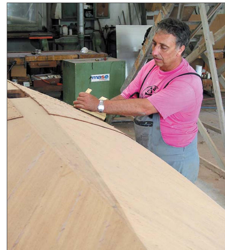
Neubauten – wieder entsteht ein neuer Lacustre, Bau in formverleimter Holzbauweise, schichtweise Furnier-Verleimung eines neuen Rumpfes.