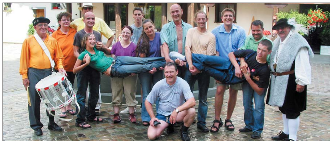
Gruppenbild mit Gautschmeister – Gautschete der Druckerei E. Schoop AG auf dem Fischmarktplatz.

Laut ertönt auf dem Fischmarktplatz der Ruf des Gautschmeisters: