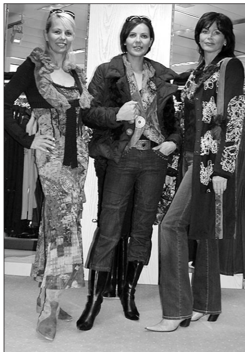
Die aktuellen Kollektionen von Mode Bonsaver, Arbon, zeigen sich in einer neuen Schlichtheit.

schige Wollgarne bringen ein schmeichelndes, anschmiegsames Volumen. In Kombination dazu bieten Denim, Cord, Velvet und klassische Herrenstoffe einen interessanten Kontrast. Ru-hige Farbtöne wie Schwarz, Grau, Weiss, Schoko, Mokka und Cognac betonen die neue Schlichtheit. Die feminine Note dekorativer Elemente kontrastiert diese Optik ausgezeichnet. Lässige Accessoires wie Ketten, edle Gürtel und flauschige Schals runden das Outfit schliesslich hervorragend ab. ia