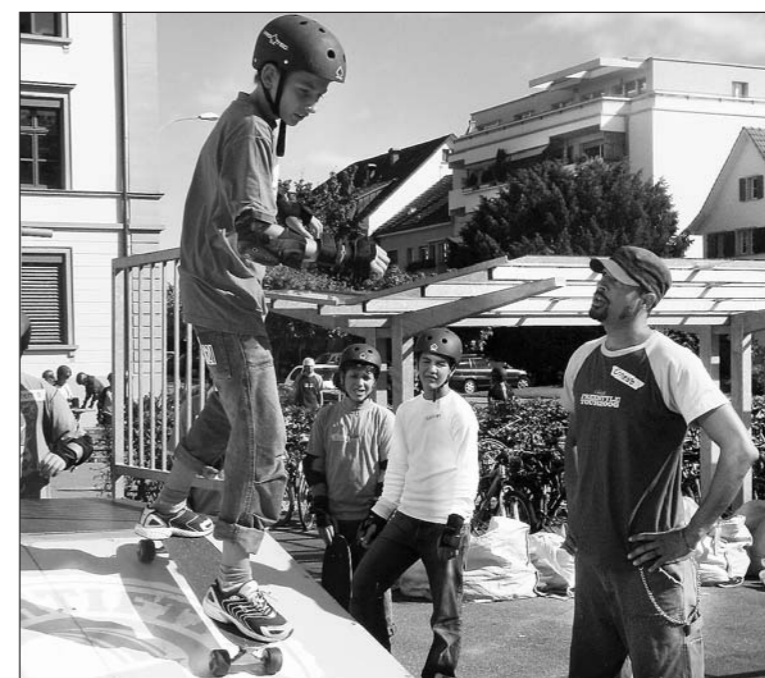
«Schtifti»-Freestyle-Profis verraten den Realschülern ihre besten Tricks.

Wenn Realschüler in ihrer Sprache nach Superlativen suchen, müssen sie schon etwas ganz Besonderes erlebt haben. In der Tat genossen die Jugendlichen den kürzlichen Abstecher der «Schtifti»-Freestyle-Tour nach Arbon. Spielerisch wurden sie zu mehr Bewegung und gesünderem Essen aufgefordert.