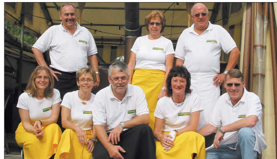
Im Grotto Ticinese sorgen die «Kanonechöch» mit Anhang für zufriedene Gäste.