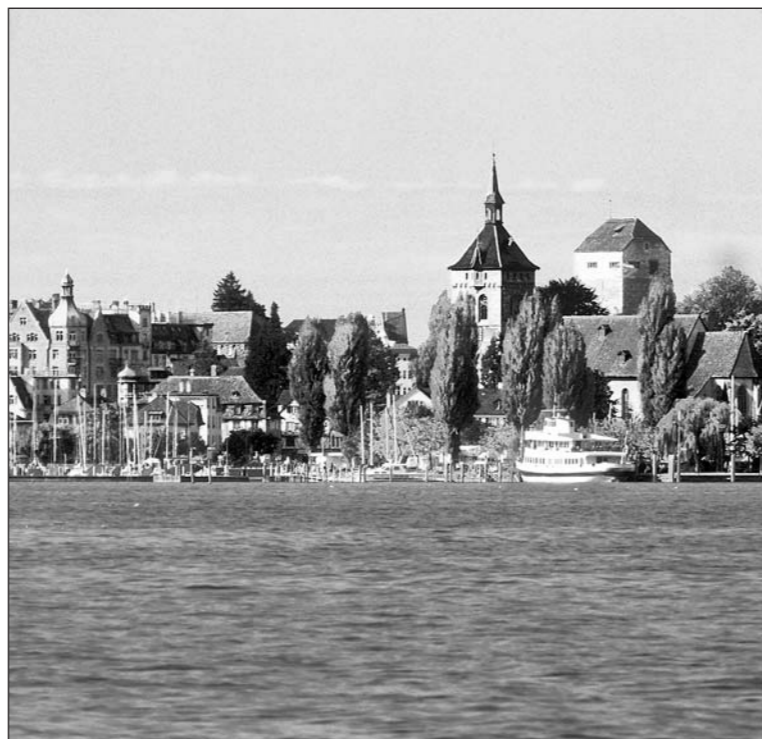
20 Jahre SVP Arbon, 20 Jahre für Arbon: Volles Engagement für Arbon zeigt die SVP gerade auch in ihrem Jubiläumjahr.