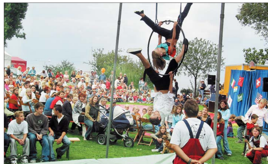
Kinder-Circus Ro(h)rspatz – hervorragende Akrobatik durch die «Little Stars».