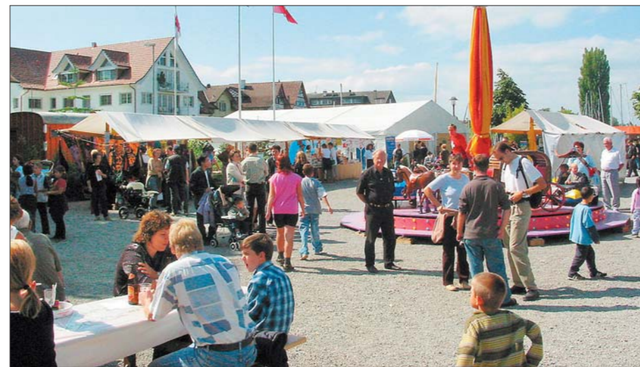
Horner Chilbi – ein Treffpunkt für Gemütlichkeit weit über die Gemeinde Horn hinaus.