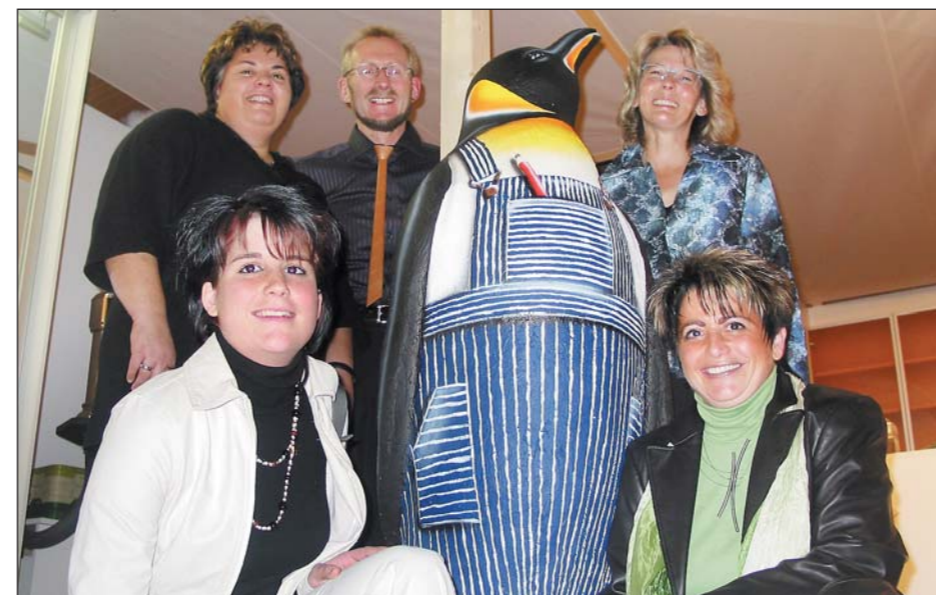
Fest in Steinacher Hand: Der Stand der Schreinerei Huser.

Eiszeit? Absolut nicht! Denn was die Arboner Weihnachtsausstellung zu bieten hat, ist alles andere als eine «Gewerbeschau mit Gefrieratmosphäre». Und wer geglaubt hat, dass eine Steigerung gegenüber den Vorjahren nicht mehr möglich ist, sieht sich getäuscht. Mit viel Liebe haben die Gewerbetreibenden ihre Stände dekoriert und dem Seeparksaal ein vorweihnachtliches Ambiente verliehen. Insbesondere die prächtigen Pinguine stossen auf grosse Beachtung mit vielen positiven Stimmen. – «felix. die zeitung.» hat sich an der Arwa umgesehen.