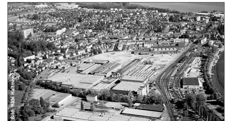
Vom total 242 000 Quadratmeter umfassenden Areal Saurer WerkZwei sollen rund 6,6 Hektaren der bestehenden Industriezone in die Wohn- und Gewerbezone hoher Dichte sowie rund 800 Quadratmeter in die Wohn- und Gewerbezone mittlerer Dichte verlagert werden.

Nirgendwo im Kanton Thurgau kann ein so grosses Areal wie das Saurer WerkZwei für eine Stadtentwicklung genutzt werden. Diese einzigartige Chance gilt es mit einer zukunftsweisenden Zonenplanänderung zu nutzen.