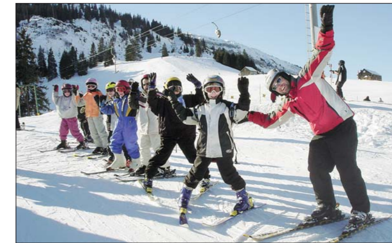
Spass ist garantiert in der KTV-Schneesportschule.

Bereits zum 50. Mal finden in dieser Saison – am 7., 14. und 21. Januar – die traditionellen Schneepasskurse des KTV Arbon statt.