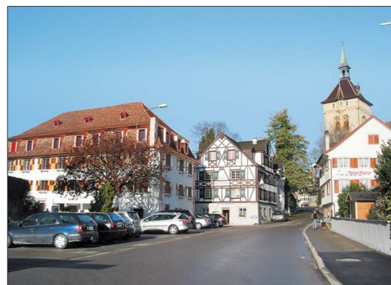
Mit seiner farbenfrohen Ausstrahlung setzt der «Schwanen» einen angenehmen Akzent im Arboner Hafenviertel.

Roland Morgenege Architektur und Innenarchitektur 9320 Arbon