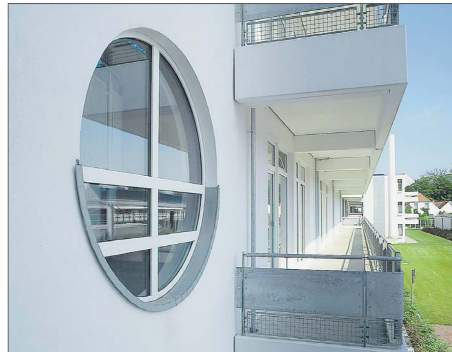
Energieoptimierte Fenster von Aerni Fenster für jedes Gebäude.

Das Streben nach bester Qualität im Rahmen eines wettbewerbsfähigen Preis-/Leistungsverhältnisses hilft mit, die führende Position von Aerni Fenster zu erhalten und sogar auszubauen. Die Bedürfnisse der Kunden werden unter Berücksichtigung der Aspekte Wirtschaftlichkeit, Qualität, Umweltfreundlichkeit jederzeit optimal gedeckt. Mit einer möglichst umweltschonenden Herstellung will Aerni Fenster nicht nur die gesetzlichen Bestimmungen einhalten, sondern diese mit kontinuierlicher Verbesserung übertreffen und somit einen aktiven Beitrag für unsere Umwelt leisten. Aerni Fenster fördert das Qualitäts- und Umweltbewusstsein der Mitarbeiter mit kontinuierlicher Schulung. Mit der Öffentlichkeit und den Behörden sucht das Unternehmen einen offenen Dialog. – Das Motto am Arbeitsplatz: «Mit unserem Einsatz wollen wir für unsere Kunden eine umweltschonende, qualitativ hochstehende Leistung erbringen. Jeder Mitarbeiter ist für die Qualität in seinem Tätigkeitsbereich verantwortlich.»