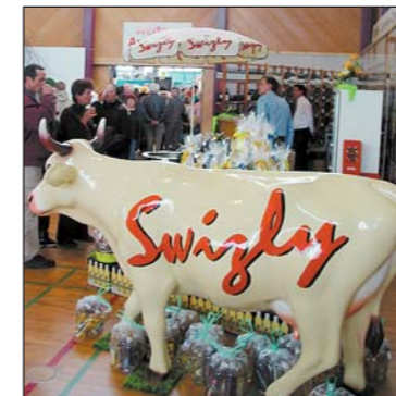
Mosterei Möhl AG – seit Jahren Stammgast an der Frühlingsmesse.