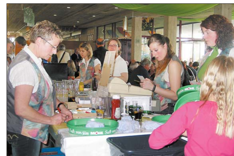
Sie sorgten für zufriedene Gäste – die Mitglieder der Holzmaskenzunft hatten die Gastronomie wie gewohnt bestens im Griff.