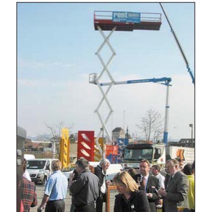
Sonniger Eröffnungsapéro mit geladenen Gästen vor dem Saal.