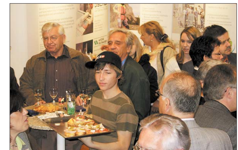
Die Gemeinde Tübach lud zum Behördenapéro – für eine Stunde gab es auf der Bühne im Seeparksaal kaum ein Durchkommen.