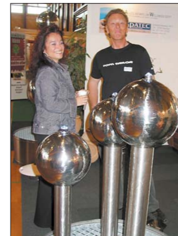
Offenes Feuer und charmante Beratung bei der Hama AG.