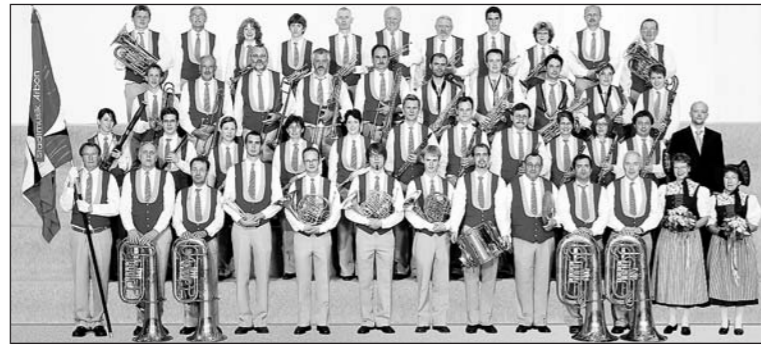
Noch präsentiert sich die Stadtmusik Arbon in ihrer 23-jährigen Uniform.