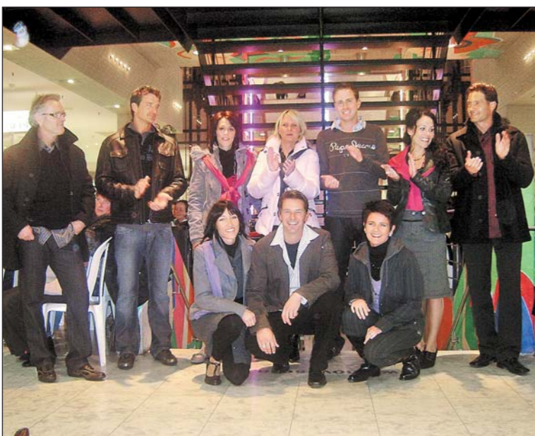
Die neue Mode fällt neutral und dunkel aus. Deshalb sind Farbakzente bei kleinen Teilen wie Jacke, Shirt oder bei den Accessoires sehr wichtig.