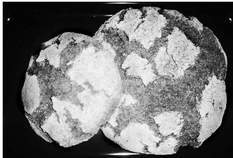
Die Kraft aus der Natur – beim «roggwilerbeck» darf morgen Samstag, 22. September, lang haltbares Roggen-Sauerteigbrot degustiert werden.

Zu einer besonderen Degustation lädt «de roggwilerbeck» morgen Samstag, 22. September, ein. Da wird Roggen-Sauerteigbrot mit Fleisch und Käse angeboten. Der Grund für diese ebenso gesunde wie originelle Aktion liegt in der Tatsache, dass Weizen- und Hefe-Allergiker immer wieder nach einer Alternative gesucht haben. Das reine Roggen-Sauerteigbrot besteht aus frisch gemahlenem Bio-Knospen-Roggenmehl sowie aus Wasser und Salz, wobei der Sauerteig unter Einwirkung von Wärme – und mit viel Geduld – entsteht. Anstelle von Hefe ist der Sauerteig ein Mittel zur Lockerung des Teiges. Bei richtiger Lagerung (kühl und trocken, am besten in einem Baumwollsack)