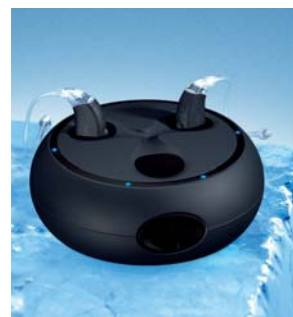
Die formschöne Ladestation bedient gleichzeitig zwei Hörsysteme.

Das ReSound Azure™ besticht durch kristallklare Klangqualität und ein natürliches Gefühl in den