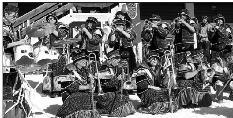
Nicht nur im Skigebiet, sondern auch in der Geneva Arena sorgen die Hüüler für Stimmung.

Wovon mancher Tennisfan träumt, wird für die Arboner Guggenmusik Arbor-Felix-Hüüler bald Realität: Sie wird die Schweizer Tennis-Cracks in Genf anlässlich des Davis Cups gegen Australien bewundern und auch tatkräftig unterstützen.