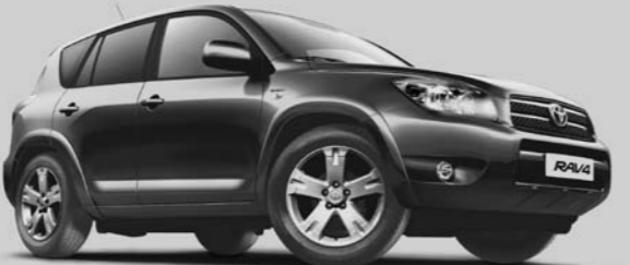
RAV4 2.2 Linea Sol «Premium» mit D-CAT, 177PS, 5-türig, ab Fr. 51'000.– Der RAV4, bereits ab Fr. 34'900.–.

www.toyota.ch Der neue Toyota RAV4: Mit ihm kommen Sie besser an.