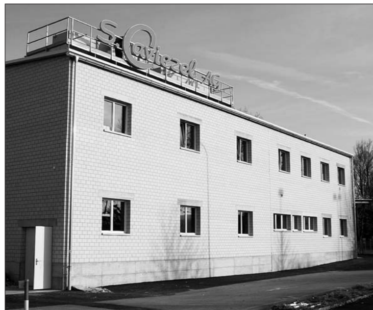
1986 wurde die S. Caviezel AG in Frasnacht gegründet, morgen Samstag erfolgt der Umzug in die neuen Räumlichkeiten im Arboner Schöntal.

Nach rund einjähriger Bauzeit kann S. Caviezel AG morgen Samstag von Frasnacht ins Arboner Schöntal umziehen. Mit dem Bezug des grosszügigen 4-Mio.-Neubaus verfügt der Betrieb mit elf Mitarbeitern über eine optimale Infrastruktur.