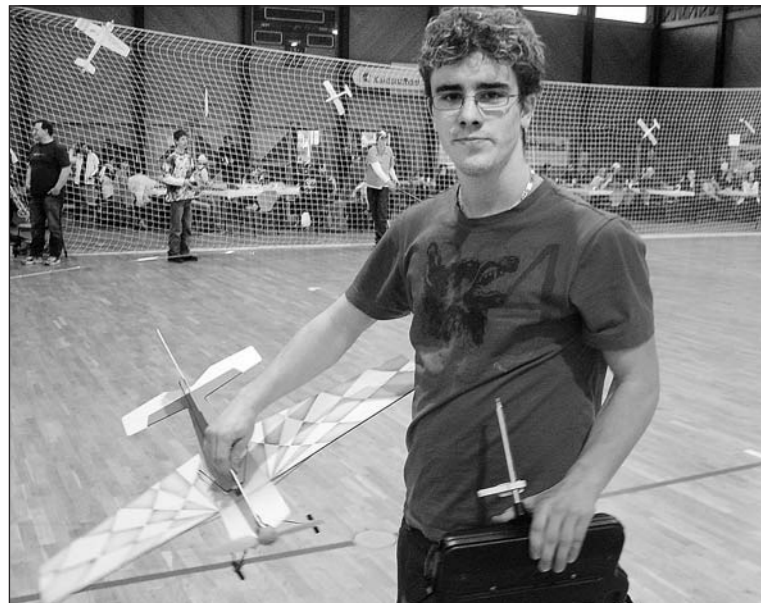
Das Indoor-Meeting im Arboner Seeparksaal hat sich zu einer der grössten «Slowfly»-Veranstaltungen in der Schweiz gemauert.

Bereits zum vierten Mal findet am 8. und 9. März das Indoor-Meeting im Seeparksaal in Arbon am Bodensee statt. Mit rund 1200 Besuchern und 40 Piloten am Tag zählt dieser Anlass zu den grössten Slowfly-Veranstaltungen in der Schweiz.