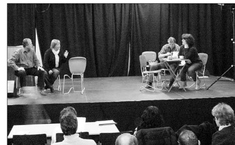
«Lueged emol verbii» – es darf herzlich gelacht werden.

Die Theatergruppe Frasnacht, Arbon, Stachen führt am 14. und 15. März wieder eine herzhaft Komödie auf. Die 13. Produktion der Laien-Schauspieler heisst «Lueged emol verbii» und handelt von der Familie Roth, die leichtsinnig eingeladene Gäste einfach nicht mehr los wird.