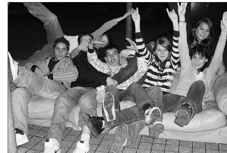
«Hängen» ist eine beliebte Tätigkeit in der «Rondelle». Aber Jugendliche in Arbon sollen sich nicht nur zu einer reinen Konsumgesellschaft entwickeln.

Die Kinder- und Jugendarbeit in der Stadt Arbon wird seit Juli 2007 von der Zusammenarbeit des Vereins Jugendbegegnungsstätte «Rondelle» (JBS «Rondelle») mit der Stadt Arbon getragen. Damit sich Jugendliche auch ausserhalb des Jugendtreffs «Rondelle» angesprochen fühlen, wird die Sozialarbeit verstärkt auf eine aufsuchende Kinder- und Jugendarbeit ausgerichtet.