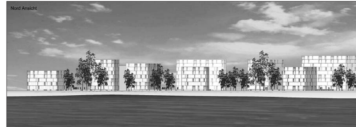
Auf dem 3,3 Hektaren grossen Radunerareal soll eine grosszügige Wohnsiedlung mit viel Grünraum entstehen.

Horn steht vor einer wichtigen Entscheidung! An der Gemeindeversammlung vom Mittwoch, 9. April , ist der Souverän aufgerufen, über eine Zonenplanänderung betreffend Radunerareal zu befinden. Geplant ist eine neu zu schaffende Spezialzone «Höhere Häuser HH».