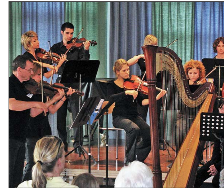
Spannende Tanz- und Konzert-Events – die Aufnahme stammt aus der Aufführung «Peer Gynt» – prägen das Motto «Musik & Erzählung».