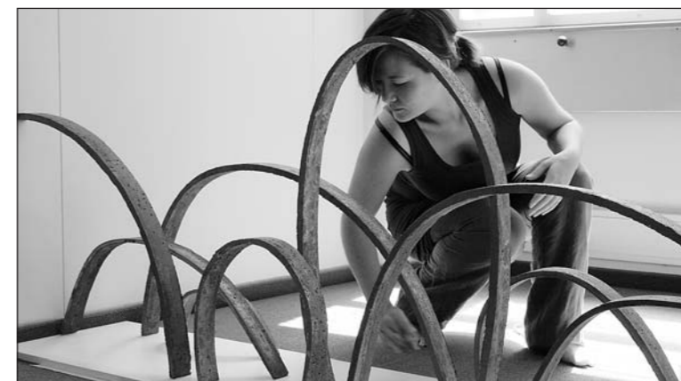
Letzte Vorbereitungen für die zweiwöchige Werkausstellung im ZaK.

Was Absolventen der Schule für Gestaltung in St.Gallen zu leisten vermögen, zeigt eine Werkausstellung «Farbe Form und Raum FFR» von 28 Studierenden. Die Präsentation im ZaK an der Schlossgasse 4 dauert vom 14. bis zum 26. Juni.