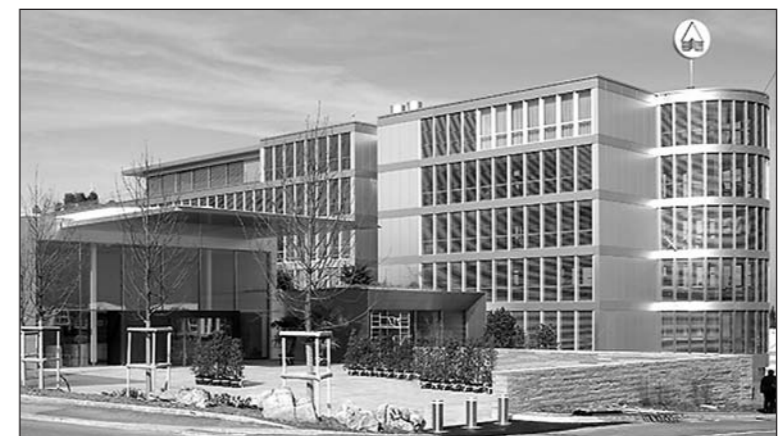
Die AFG-Verantwortlichen sind zuversichtlich, den Gewinn 2008 gegenuber dem Vorjahr leicht steigern zu konnen, zumal im zweiten Halbjahr aufgrund der besseren Auslastung uberproportional hohe Ertrage generiert werden.

Die AFG Arbonia-Forster-Holding AG ist im ersten Halbjahr 2008 in einem schwieriger gewordenen Umfeld erneut zweistellig gewachsen. Mit einem Umsatzwachstum von 10.3 Prozent auf 749.5 Mio. Franken (Vorjahr 679.7 Mio.) wurde eine ansprechende Leistungssteigerung gegenuber dem Vorjahr erzielt.