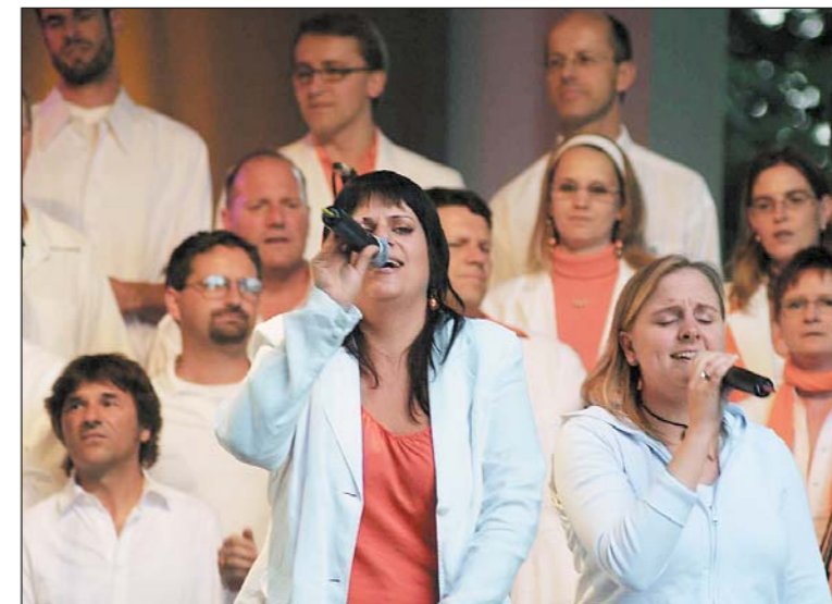
...wie im vergangenen Jahr...