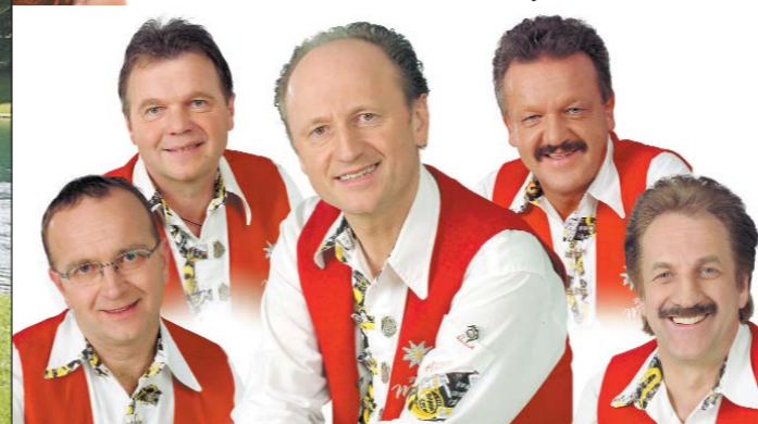
Die fidelen Mölltaler