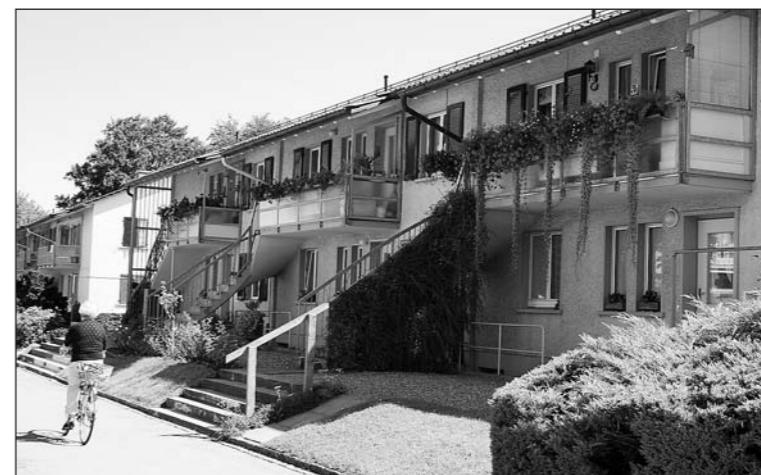
Ab September 1948 bis Herbst 1949 wurden die 36 «Stägehüsl»-Wohnungen in sechs Blöcken an der Landquartstrasse in Arbon bezogen.

Am 8. März 1948 reichte die St. Galler Baugenossenschaft «Daheim» bei der Arboner Ortsvorsteherschaft ein Baugesuch für «fünf Häuserblöcke mit total 26 Wohnungen» ein. Gebaut wurden schliesslich sechs Gebäude mit 36 Einheiten. Dies war der Beginn der abwechslungsreichen 60-jährigen Geschichte der berühmten «Stägehüsl».