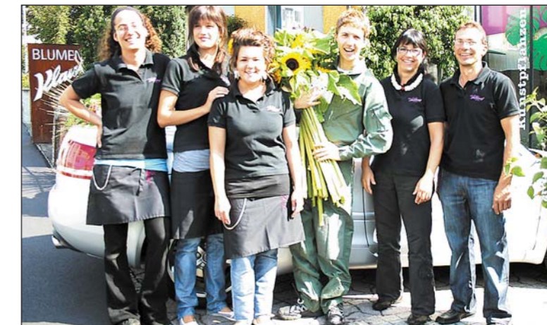
Prominenter Besuch bei Blumen Klaus in Arbon: Skispringer Simon Ammann verteilte nebst Sonnenblumen auch zahlreiche Autogramme.

Gleich nach seinem Tandem-Ab sprung mit gelungener Landung im Stacherholz wurde Simon Ammann