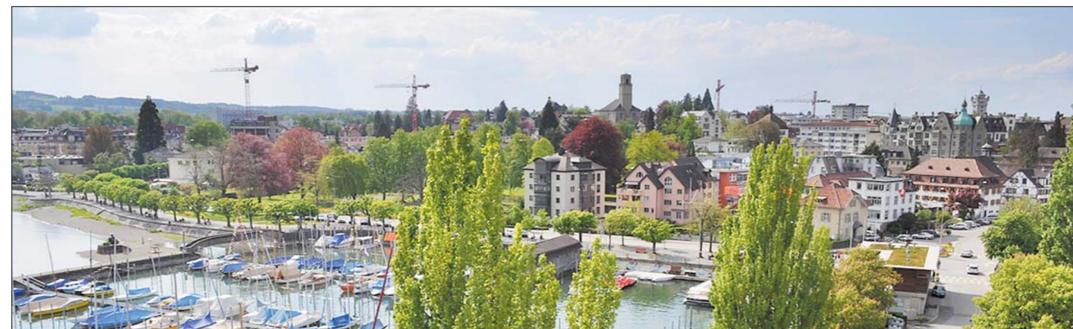
Baustelle Arbon – Baukräne überragen die Silhouette der Stadt der weiten Horizonte...