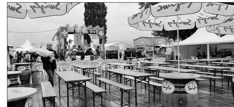
«Swizly-Arena» – garstig.