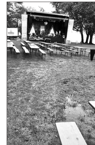
«Tiroler Blaut» – trostlos.