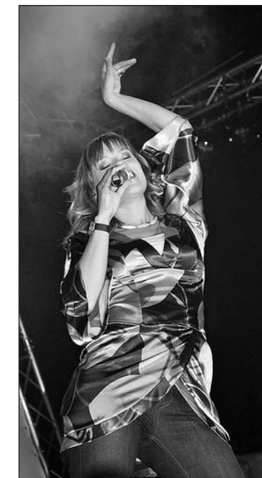
Francine Jordi – emotional.