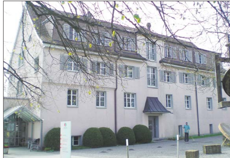
Annus Christi, Tübach.

Das aus den 30er-Jahren stammende Strandbad Arbon gehört zu den schönsten Strandbädern der Schweiz und ist bei Badegeniesern, Ruhesuchenden und «Sonnenanbetern» sehr beliebt. Bei schönem Wetter ist das Strandbad von 08.00 bis 20.30 Uhr geöffnet. Die Eintrittspreise betragen sechs