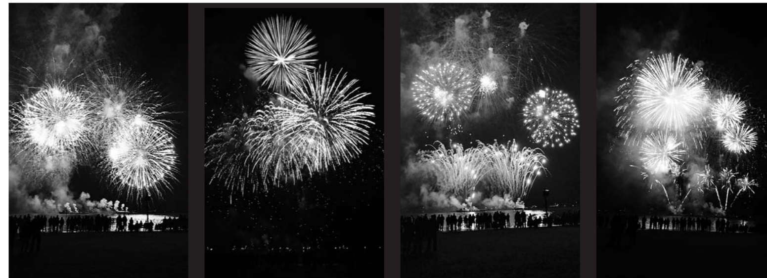
Feuerwerk – einzigartig!