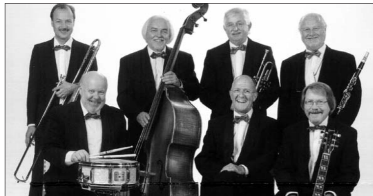
«New Harlem Ramblers»