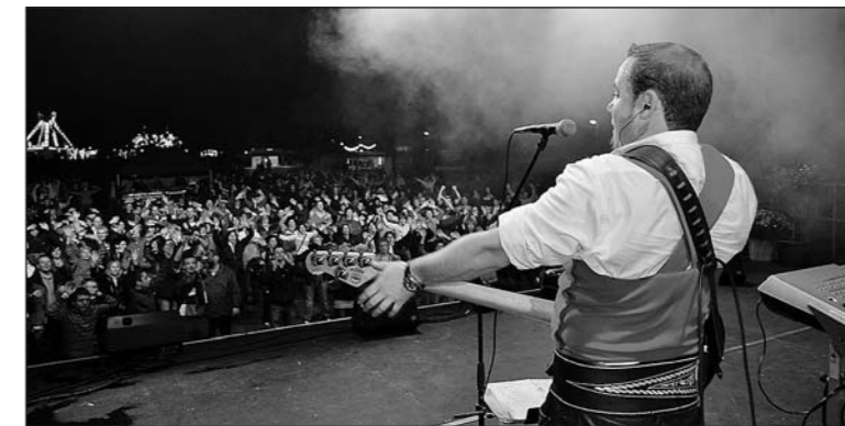
«Schürzenjäger»-Legende Fredi Pfister und Band – stimmungsgeladen.