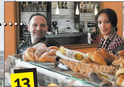
Tipps..... Südländische Verführung