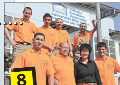
Gewerbe..... Starkes Team für Qualität