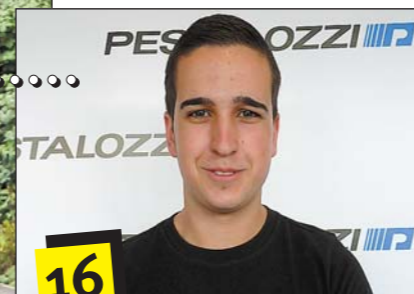
Mosaik..... Erfolgreicher Nachwuchs