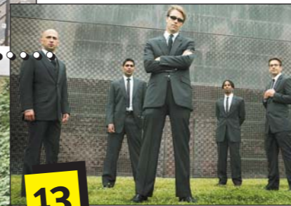
Tipps..... Energie im ZIK