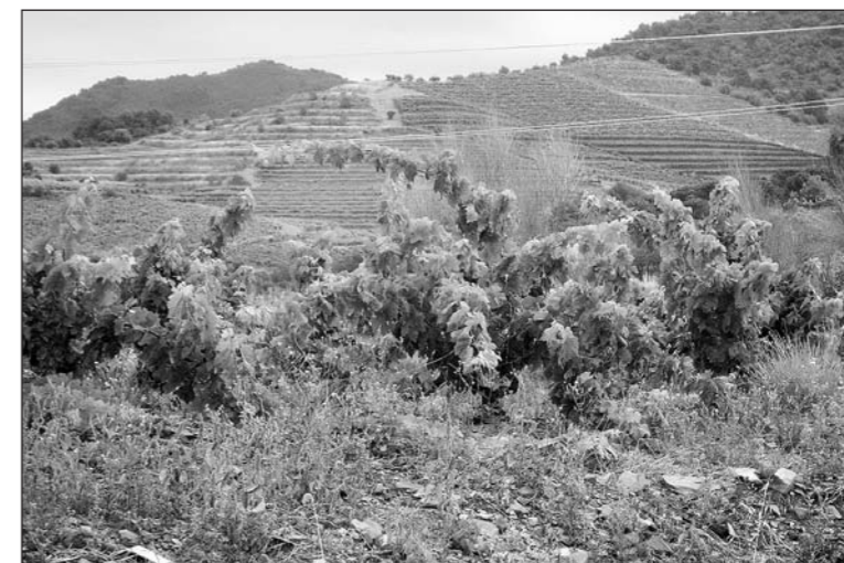
Die Auswahl der angebauten Rebsorten im Weingebiet D.O. Alicante wird streng überwacht und nur vom Consejo Regulador genehmigt.

Spanisches Temperament verzauert Weinkenner! Auserlesene Weine oder weitere spanische Spezialitäten aus der Region Alicante sind derzeit bei «Divino» beim Landi-Depositär in Steinebrunn erhältlich.