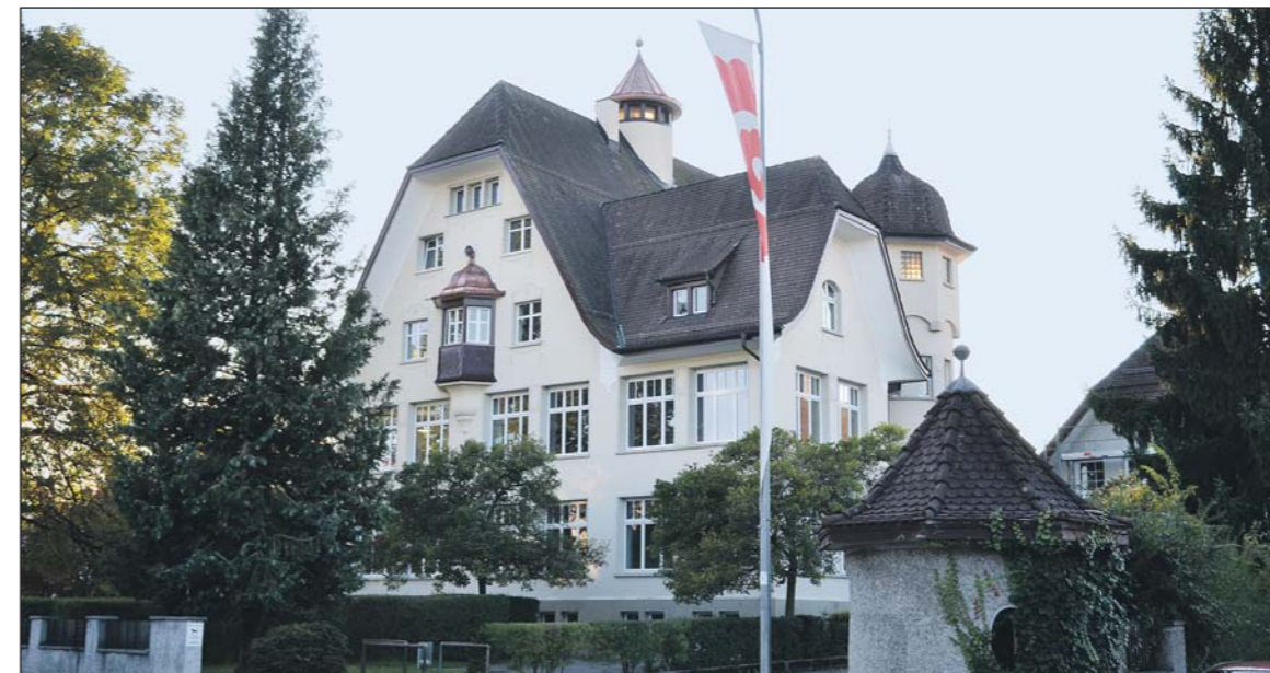
100 Jahre Schulhaus Tübacherstrasse in Horn – morgen Samstag, 12. November, wird dieses Jubiläum nach Fertigstellung der umfangreichen Gesamtrenovation ab 12 Uhr bis in die Nacht hinein ausgiebig gefeiert.

Wo neuer Glanz entsteht, soll gefeiert werden! So auch in Horn, wo das 100-jährige Primarschulhaus einer Gesamtrenovation unterzogen wurde. Morgen Samstag, 12. November, läutet die vom Schulhaus an der Seestrasse ins «Türmli» an die Tübacherstrasse dislozierte, 167-jährige Glocke um 12 Uhr einen festlichen Tag ein.