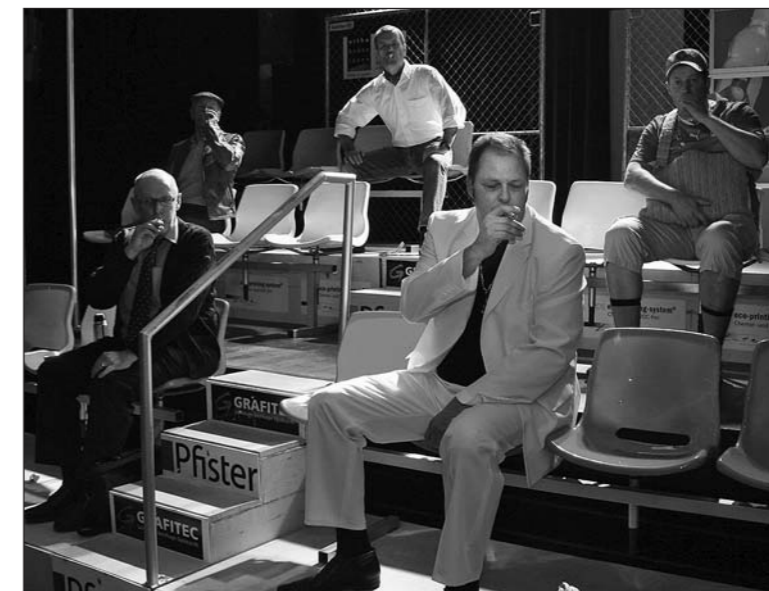
Die «Männer!» werden das Publikum im Kulturlokal ZiK mit ihren beschwingt-komödiantischen Liederabenden bestens unterhalten.

Die komödiantischen Liederabende im ZiK in Arbon von heute Freitag und morgen Samstag, 11./12. November, um 20 Uhr sind ein stimmungsgewaltiger Genuss – ein psychologisch-musikalischer Striptease.