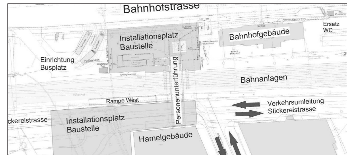
Während der aktuellen Bauarbeiten der Personenunterführung beim Bahnhof Arbon bleibt der Zugang zu den Liegenschaften an der Stickerstrasse und Bahnhofstrasse jederzeit gewährleistet.

Die «Neue Linienführung Kantonsstrasse» NLK in Arbon soll bis Herbst 2014 abgeschlossen sein. Nach den Vorbereitungsmaßnahmen steht die nächste Etappe an: die Erstellung der Bahnunterführung auf dem Gemeindegebiet von Steinach und die Personenunterführung beim Bahnhof Arbon.