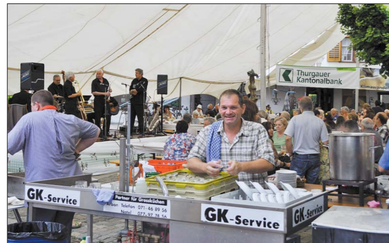
Vertrautes Bild bei der Dixie-Matinée – Mitglieder des Quartiervereins Altstadt sorgen auf dem Arboner Fischmarktplatz für zufriedene Gäste.

riano» morgen Samstag, 29. Juni, ab 12 Uhr bis Mitternacht zu einer abwechslungsreichen Fiesta Española. Dabei kommen Liebhaber des spanischen Nationalgerichts voll auf ihre Rechnung. Eingeweiht wird näm-