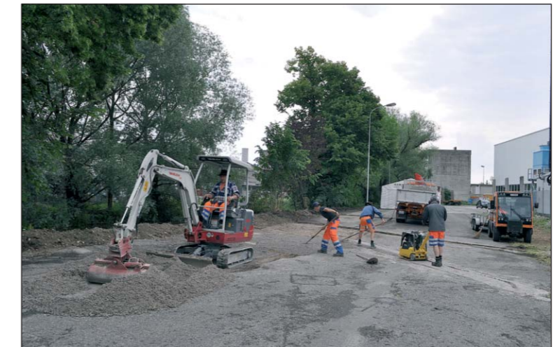
Letzte Vorarbeiten für die provisorische Arboner Sammelstelle im «Saurer WerkZwei», die am Dienstag, 2. Juli, eröffnet wird.

Die Sammelstelle im Werkhof an der Salwiesenstrasse 3 in Arbon hat ihre Kapazitätsgrenzen erreicht! Da zugleich mit der Eröffnung der «NLK» das Verkehrsaufkommen zunehmen wird, zieht die Sammelstelle provisorisch ins «Saurer WerkZwei» hinter die Firma Alduco um.