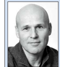
Andreas Balg, Stadttammann Arbon

Ein intensives Jahr geht zu Ende. Aber was gibt es Schöneres, als auf eine intensive Zeit zurück zu blicken und zu erkennen, dass sich der Einsatz auch gelohnt hat: die Eröffnung der «NLK», die Verkehrsreduktion in der Altstadt, erstes Interesse für die Nutzung der freiwerdenden Strassenflächen, der erste Spatenstich am Ufer der Steinacher Bucht und viele Vorbereitungen für Umsetzungen im kommenden Jahr. Die Unterstützung für die weitere Attraktivitätssteigerung der Altstadt ist gross. Mit der nötigen Portion Glück haben wir vielleicht bald wieder einen Wochenmarkt, zusätzliche Läden und weitere Verschönerungen und Investitionen. Arbon bewegt sich. Deutlich spür- und sichtbar wird dies Anfang Januar durch die neue Verkehrsführung auf Haupt- und Promenadenstrasse. Mit der Begrünung im Frühling werden wir ein zusätzliches Gefühl für die «neue» Altstadt bekommen. Mein herzlichster Dank geht an all jene, welche sich schon seit langer Zeit für Arbon engagieren, an alle, die mitgeholfen haben, dass 2013 ein gutes Jahr geworden ist und besonders an die Mitarbeitenden der Stadtverwaltung, die wiederum einen wirklich guten Job gemacht haben. Ich wünsche Ihnen allen ein schönes Weihnachtsfest, einen guten Start ins 2014, und ich bin jetzt schon gespannt, was wir 2014 alles gemeinsam erreichen werden.