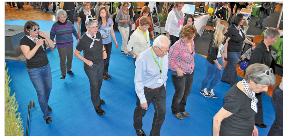
Die «messe am see» im Seeparksaal lebt nicht nur von rund 60 Ausstellern, sondern auch von den «Golden Ager».

23. Wiederum ist die Velobörse auf dem Fischmarktplatz ein Renner. Insgesamt wechseln über 120 gebrauchte Fahrräder die Besitzer.