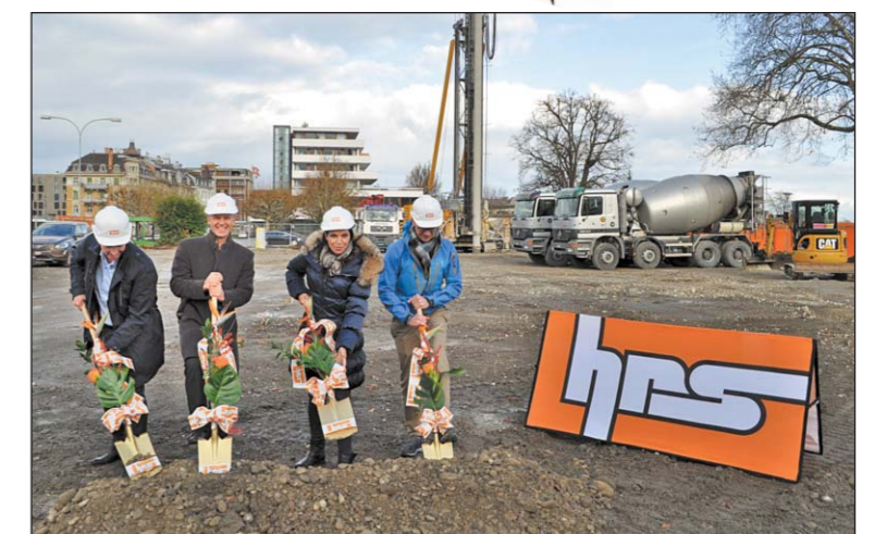
Spatenstich für die HRS-Überbauung «Haus am See». Für 22 Millionen Franken werden neben dem Hotel Metropol zwei Mehrfamilienhäuser am Arboner Seeufer mit komfortablen Eigentumswohnungen gebaut.

wünscht allen Leserinnen und Lesern einen guten Start ins neue Jahr.