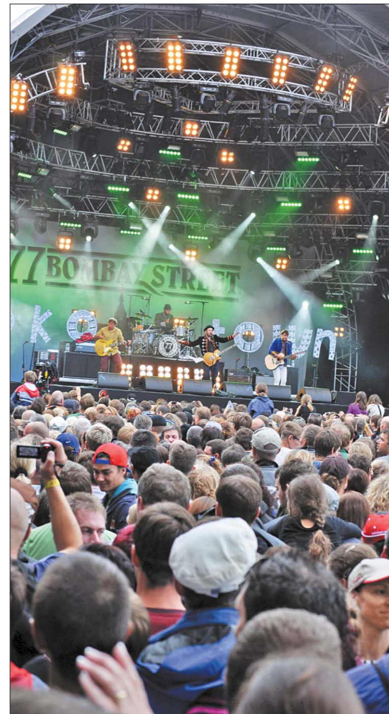
Un glaubliche Stimmung am Arboner «SummerDays»-Festival. Auch die Gruppe «77 Bombay Street» weiss am wohl schönstgelegenen Schweizer Open Air auf den Arboner Quaianlagen zu begeistern.

12. Das NLK-Teilstück von Steinach bis zur Landquartstrasse wird freigegeben. Erster Autofahrer ist um 11.46 Uhr der Arboner Francesco Collatto.