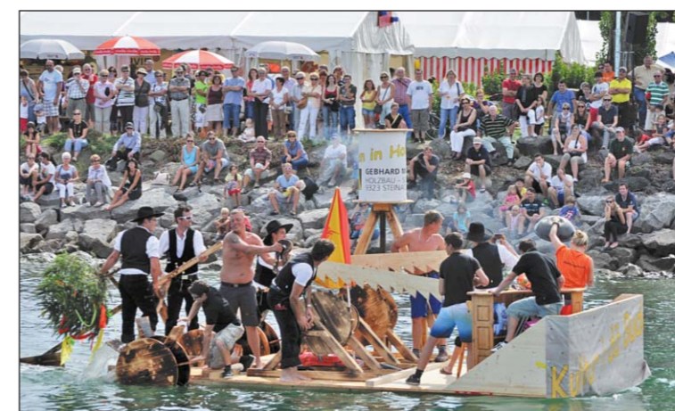
Die erste «Chübelregatta» am Horner Seefest wird zu einem Vollerfolg.

31. Saurer transportiert die 300. Stickmaschine Epoca 6. zur Firma W. Reuter & Sohn im sächsischen Auerbach.