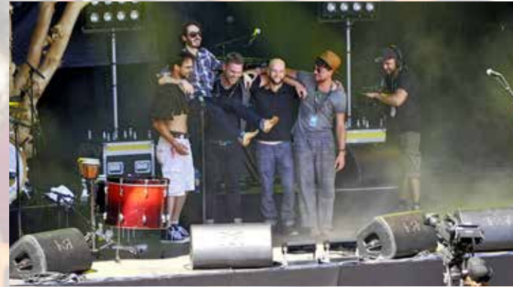
The Gardener & the Tree – auch Schweizer Musik kann begeistern.

Das siebte «SummerDays»-Festival ist vorbei, die Erinnerungen werden noch lange nachklingen! Was die 11 000 vorwiegend älteren Freaks am rockigen Freitag und die 10 000 Fans am familienfreundlichen Samstag an den Arboner Quaianlagen erlebt haben, ist kaum noch zu überbieten. Überstrahlt wurde der zweitägige Topevent vom herrlichen Spätsommerwetter, das nebst abwechslungsreichen musikalischen Gigs viel zur prächtigen Stimmung beitrug. Das Fazit der zufriedenen Macher: «Wir erlebten musikalische Helden und fantastische Sommertage am wohl schönsten Open Air am Bodensee.» Dazu passt auch die erfreuliche Erkenntnis der Polizei: «Das Festival verlief friedlich und ohne nennenswerte Zwischenfälle.» – «felix. die zeitung.» war mit der Kamera zwei Tage lang hautnah dabei... und freut sich bereits auf das achte Festival am 26. und 27. August 2016!