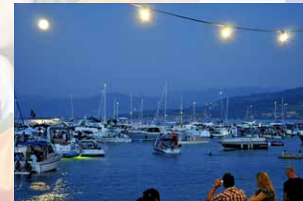
Auch die beiden «SummerNights» weckten Gefühle.