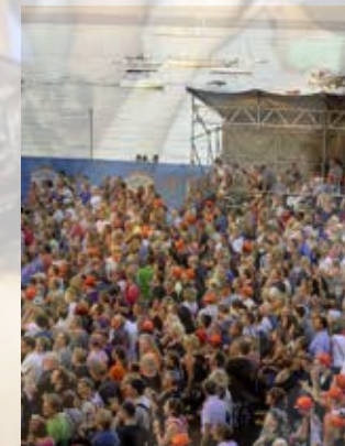
Zwei echte «SummerDays»!