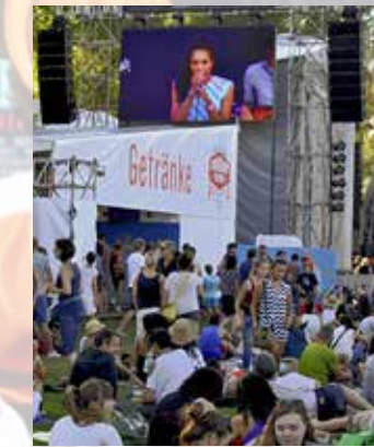
Die Gemütlichkeit des Seins.