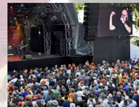
Fish – ein gelungener «SummerDays»-Auftakt.