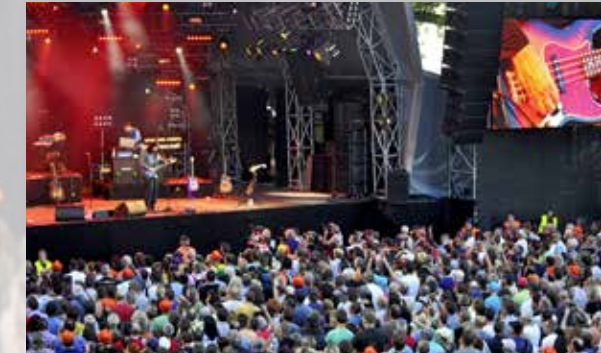
Alan Parsons – für viele der absolute Topact.