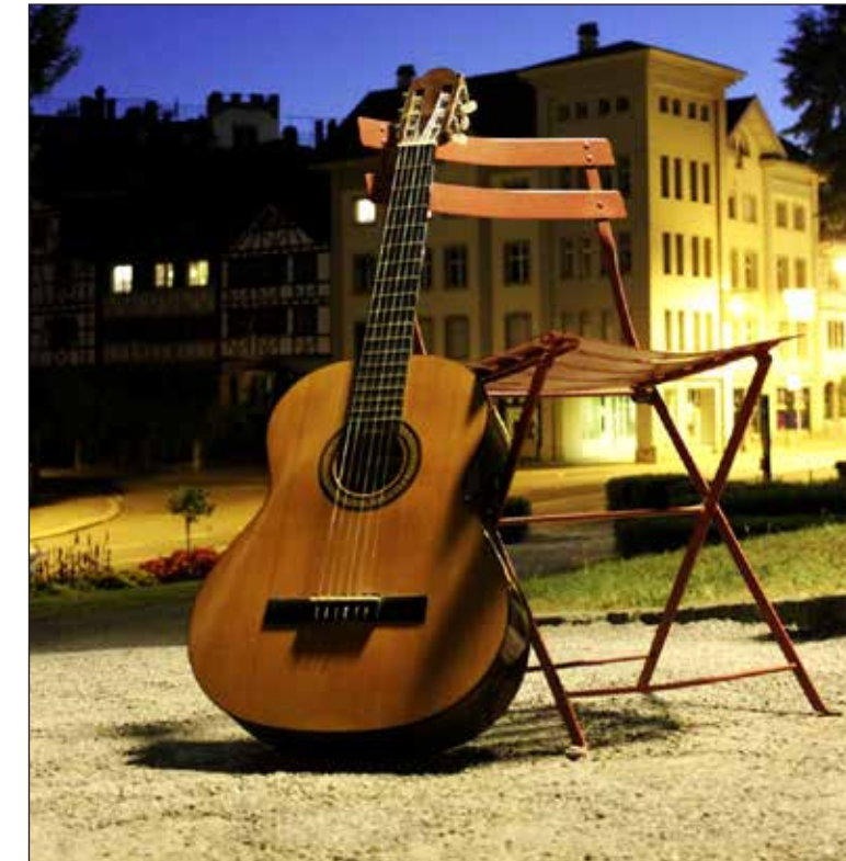
Die «Uestuehlete» soll das Zusammenleben in der Arboner Altstadt fördern. Entstanden ist die Idee an den Workshops «Lebensraum Altstadt», welche die Stadt Arbon im Jahr 2013 durchgeführt hat.

Bunte Reihe am Nachmittag Wer gerne neue Facetten der Arboner Altstadt entdecken will, kommt an der «Uestuehlete» auf