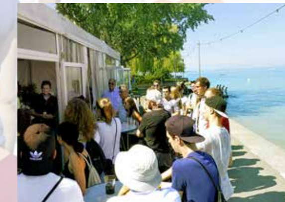
Die Arboner Jungbürger wurden bevorzugt behandelt.