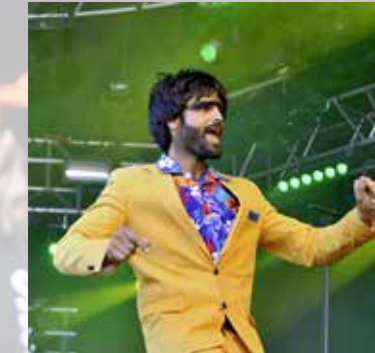
Müslüm – kein Kommentar ...