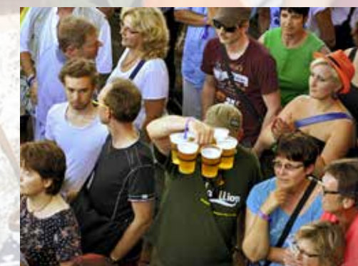
Durst – ein permanentes Thema am Festival.