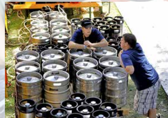
Biermänner auf Pikett – für den Nachschub bereit.