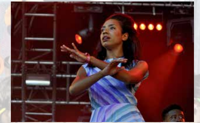
Y'Akoto – aufregend für Auge und Ohr.