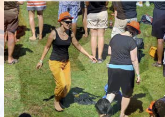
Seinen Gefühlen einfach freien Lauf lassen ...