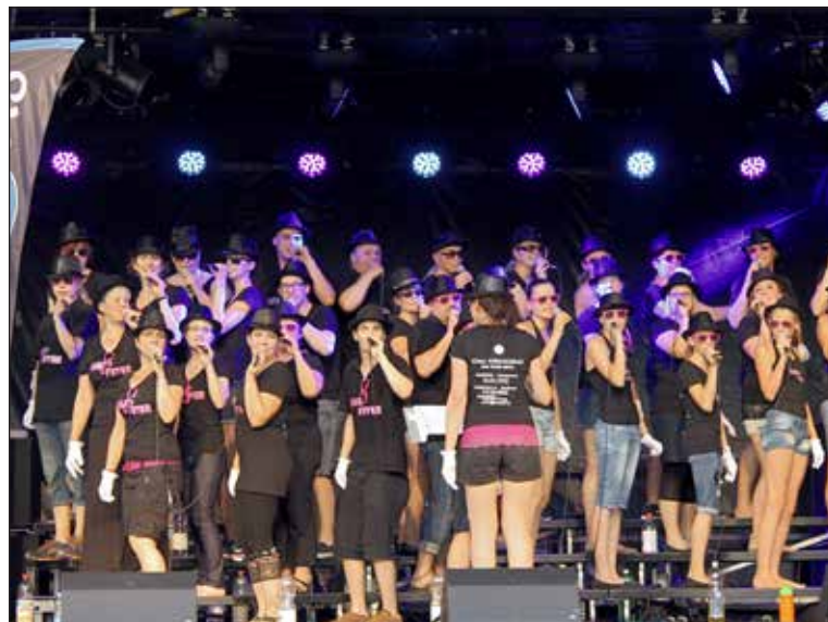
Lampenfieber gehört dazu: Der Amazonas-Chor ist nach langen Proben bereit für die Premiere von «Light Fever», am Samstag in Amriswil.