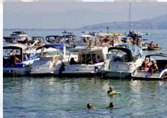
«SummerDays» einmal anders – nicht weniger schön.