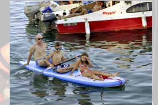
Wer braucht schon eine Yacht zum Geniessen?