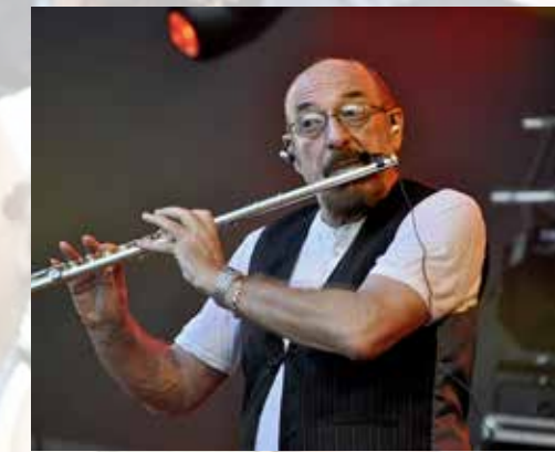
Ian Anderson – sein 47. Jahr auf der Bühne!