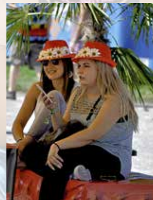
Sehen und gesehen werden.