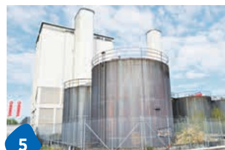
5 Noch kein Deal mit HRS