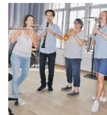
Die Lehrkräfte für Blasinstrumente - Vorfreude auf den Unterricht.