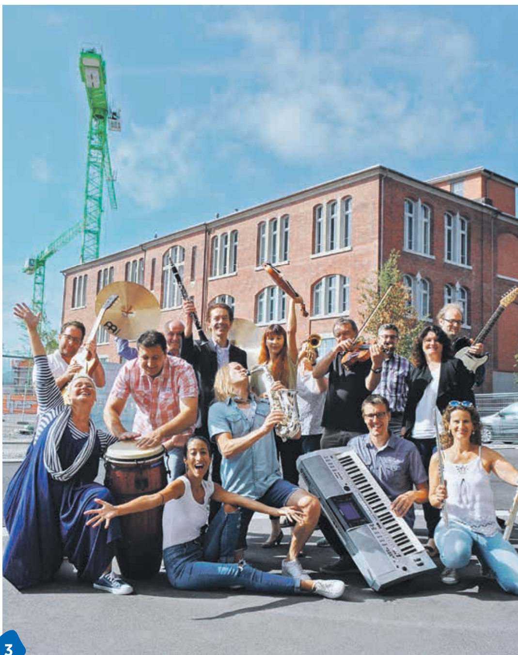
3 Los gehts! Ab Montag unterrichten die Lehrkräfte der Musikschule im Presswerk