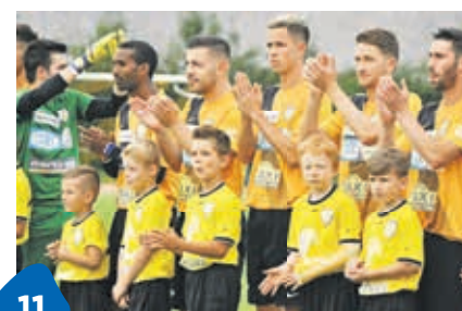
11 Cup-Sensation bleibt aus