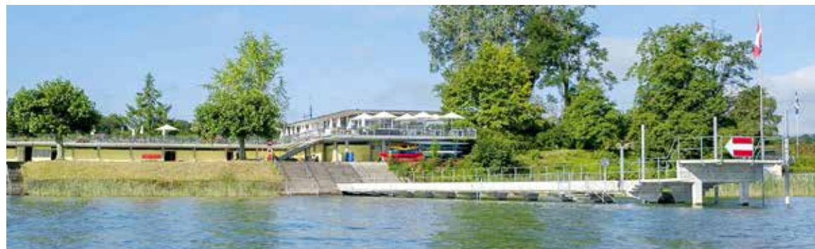
Strandbad Arbon: Für die Sauberkeit, Sicherheit und Mitarbeiter gab es von 80 Prozent der Umfrageteilnehmenden das Prädikat «gut» oder «sehr gut».

Die grosse Mehrheit der Gäste im Schwimmbad und im Strandbad Arbon ist mit den Betrieben, der Infrastruktur, dem Gastroangebot und den Mitarbeitenden sehr zufrieden. Ebenso positiv bewerten die Gäste des Campings Buchhorn das Angebot. Dies geht aus einer im Juli 2017 durchgeführten Umfrage zur Kundenzufriedenheit hervor.