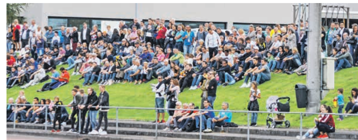
Spiel mit Volksfestcharakter: 500 Zuschauer verfolgten das Schweizer-Cup-1/32-Final zwischen FC Arbon und FC Wil.