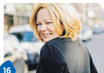
16 Autorin mit schräger Story