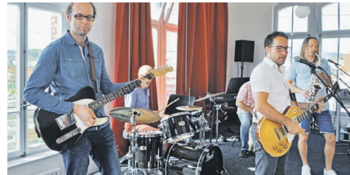
Bandraum mit fix installierter Bühne im zweiten Stock: Der «Rock-/Pop-Saal» steht künftig Musikschulbands, Bläserensembles, der Bigband «One for you» und anderen Formationen zum Proben und für Auftritte zur Verfügung.