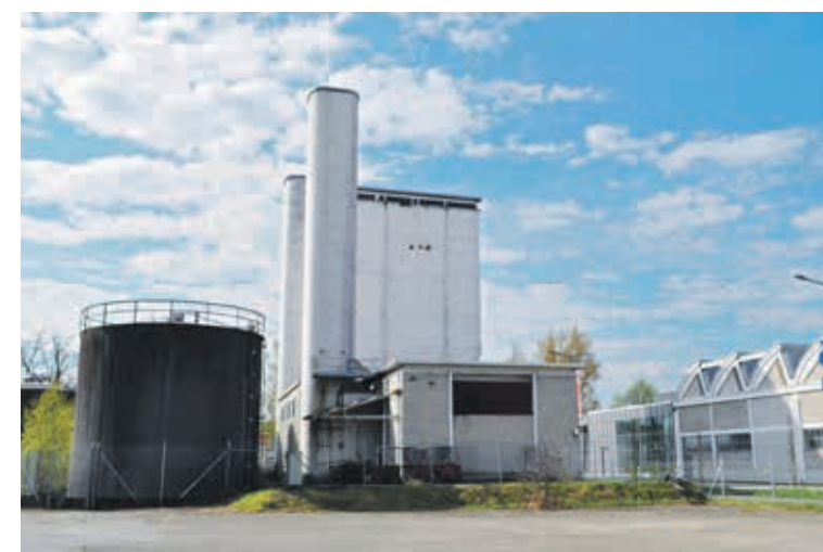
Das «Heizwerk» – ein Geschenk kann man annehmen oder nicht...

Hat Generalunternehmer HRS nun das «Heizwerk» an die Stadt Arbon verschenkt oder nicht? Amtliche Antwort aus dem Stadthaus: «Der Eigentumsübertrag hat noch nicht stattgefunden. Die künftige Nutzung ist noch unsicher.» Mit der vielsagenden Ergänzung: «Nach den bisherigen Kenntnissen sind keine Altlasten zu erwarten.»