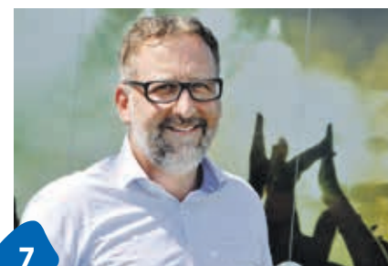
7 Arbons Mr. «Summer-Days»