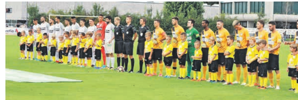
So präsentierten sich die beiden Mannschaften vor dem Spiel: Der FC Wil (in Weiss) und der FC Arbon 05 mit Balljungen.