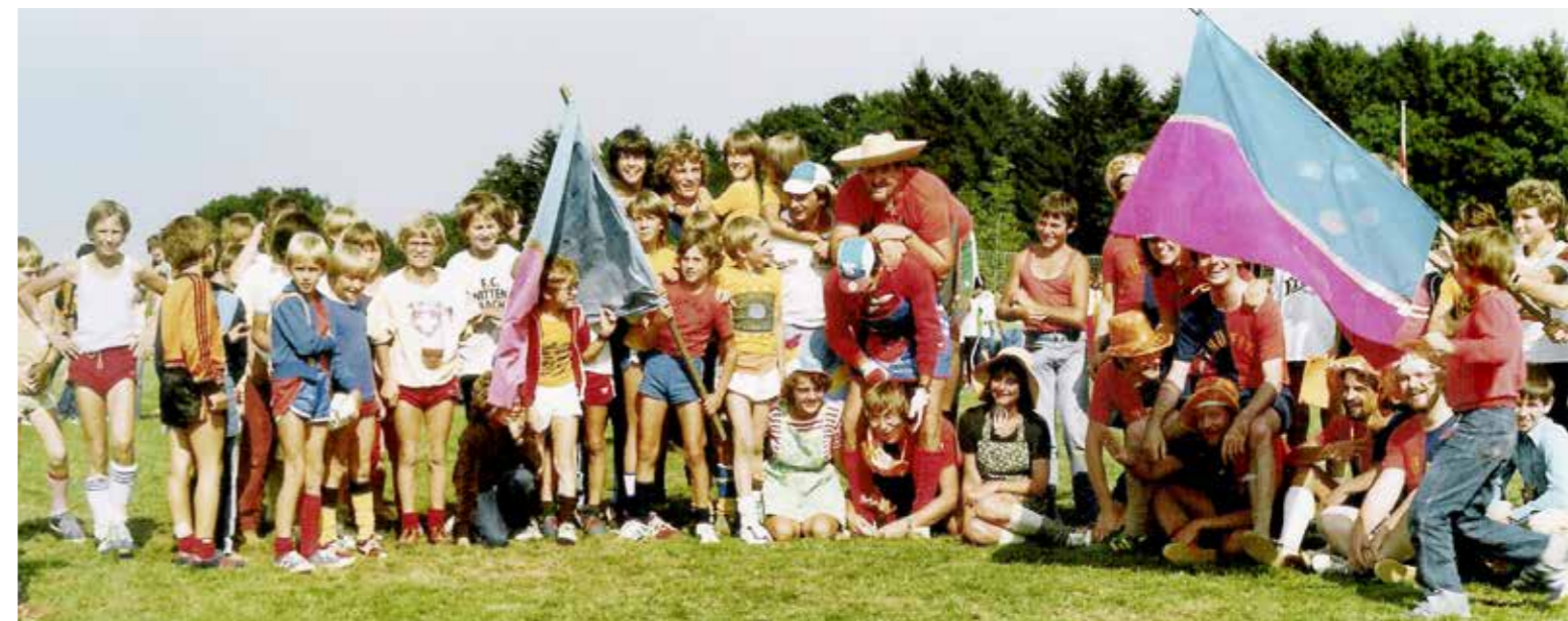
Das Grümpeli Berg wurde im Jahr 1969 ins Leben gerufen und seither jährlich durchgeführt.

Das Grümpeltturnier Berg ist der wohl grösste Anlass in der kleinen Gemeinde zwischen St. Gallen und dem Bodensee und findet dieses Jahr bereits zum 50. Mal statt. Der Geburtstag wird mit einem Dreitages-Fest und Top Show Acts gebührend gefeiert.