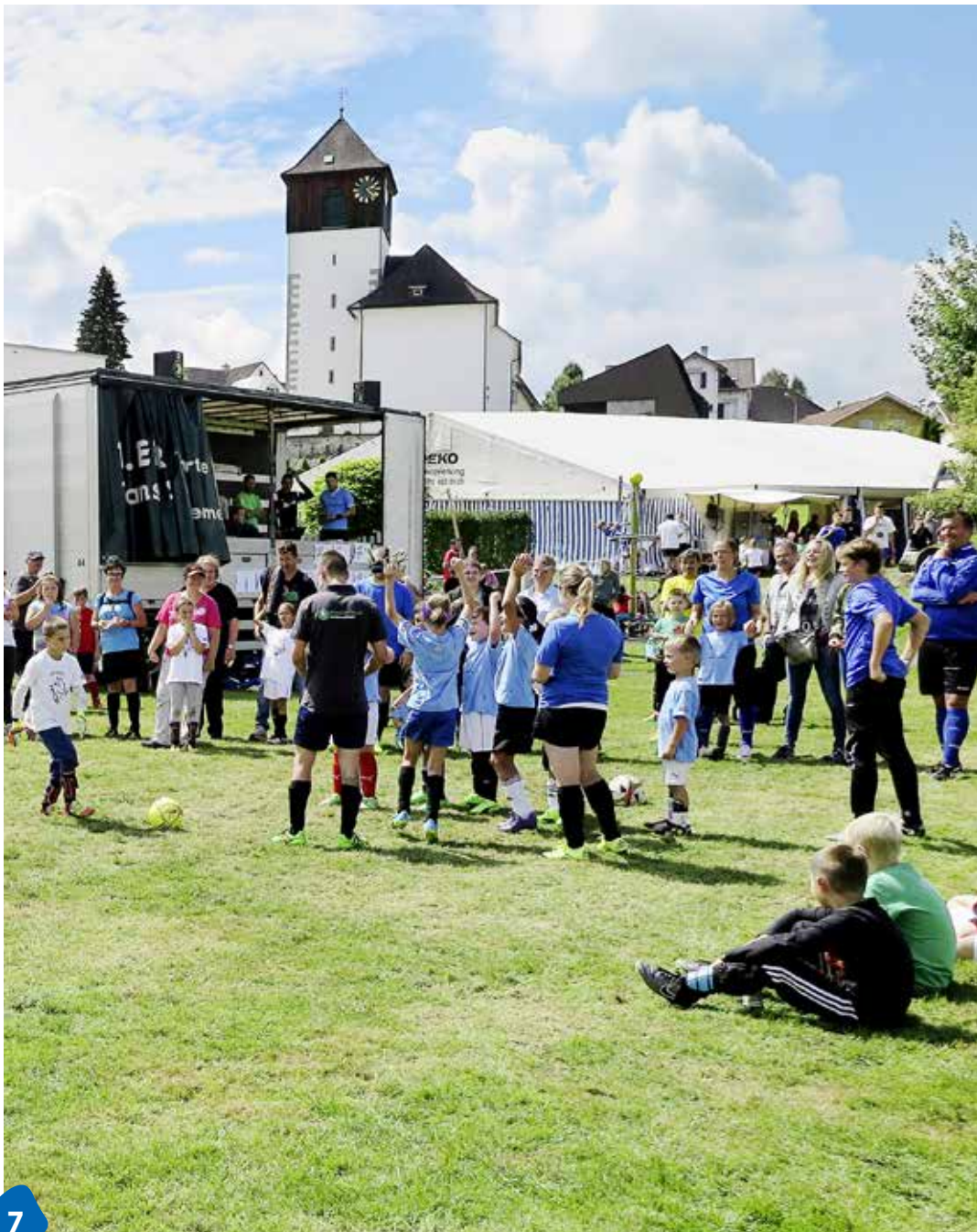
7 50. Berger Grümpeli – Drei-Tage-Fest für ein halbes Jahrhundert Tradition