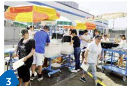
3 Millionenschaden nach Flut