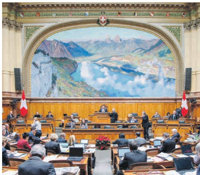
Blick in den Nationalratssaal im Bundeshaus in Bern.

Am Nachmittag lernen die Gäste die Bundesstadt näher kennen. Bern-Tourismus präsentiert auf einer Rundfahrt die wichtigsten ge-