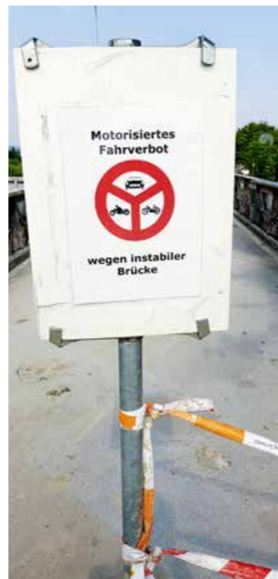
Steinach-Brücke gesperrt, da instabil.