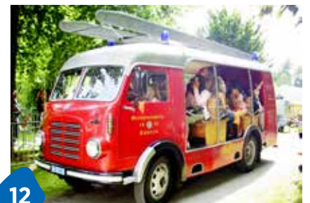
12 Wäldlifest zum Ferienende