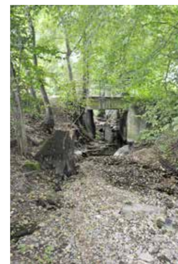
Das Bachbett des Feilenbachs in Stachen: ausgetrocknet.

Der Fachstab Trockenheit des Kantons Thurgau hat am Dienstag erneut getagt. Laut den Experten sinkt das Grundwasser infolge der deutlich unterdurchschnittlichen Niederschläge der letzten Monate stetig. Die meisten Messstationen des Grundwasservorkommens im Thurtal zeigen sehr tiefe Wasserstände auf, die zum Teil weit unter dem Mittelwert liegen. Der Fachstab Trockenheit ruft deshalb die Thurgauer Bevölkerung auf, haushälterisch mit Wasser aus dem Hahn umzugehen und es als wichtiges Nahrungsmittel zu betrachten. Etwa auf das Bewässern von Rasenflächen, das Autowaschen oder das Befüllen von Pools soll verzichtet werden. 18 Gemeinden und zwei Zweckverbände haben Engpässe in der Wasserversorgung gemeldet. Einzelne Gemeinden haben ausserdem bereits verbindliche Einschränkungen erlassen. Dem Fachstab bereitet ausserdem Sorge, dass derzeit kein Ende der Trockenheit in Sicht ist. Auch der angekündigte Regen von Ende dieser Woche wird kaum Besserung bringen. Der Wasserstand des Bodensees liegt derzeit rund 80 Zentimeter unter dem langjährigen Mittelwasserstand. Der lokale Regen vom 1. August brachte bei Bächen und Flüssen zwar für kurze Zeit eine Besserung, die Pegel fielen dann aber wieder auf das tie-