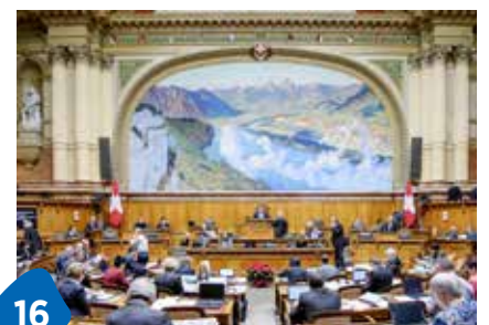
16 Politik und Bergluft