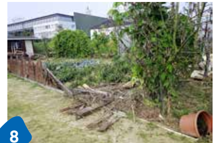
8 So wütete die Steinach