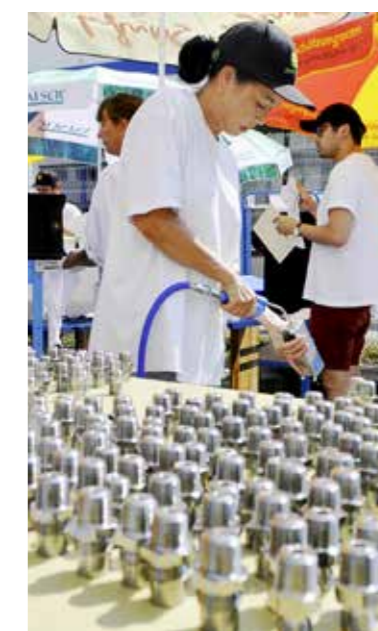
Teil für Teil wird mit Hochdruck gereinigt, getrocknet und geprüft.