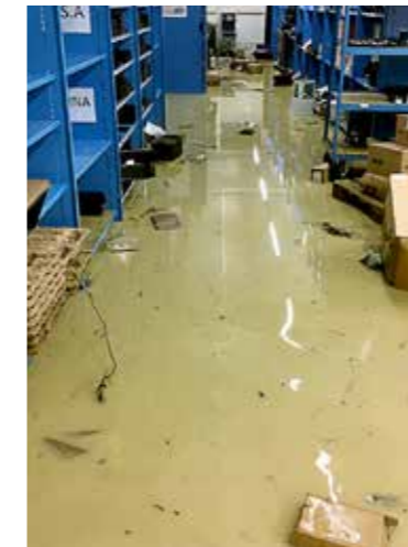
Überflutetes Lager: Viele gelagerte Bau- und Fertigteile sind zerstört.