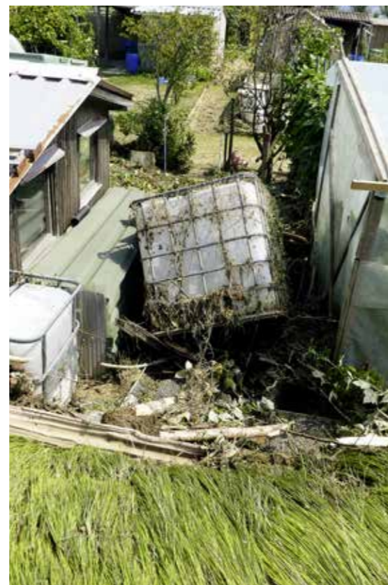
Verwüsteter Schrebergarten direkt neben der Steinach.