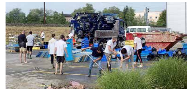
Variosystems-Personal im Grosseinsatz bei Gluthitze auf dem Firmenareal.