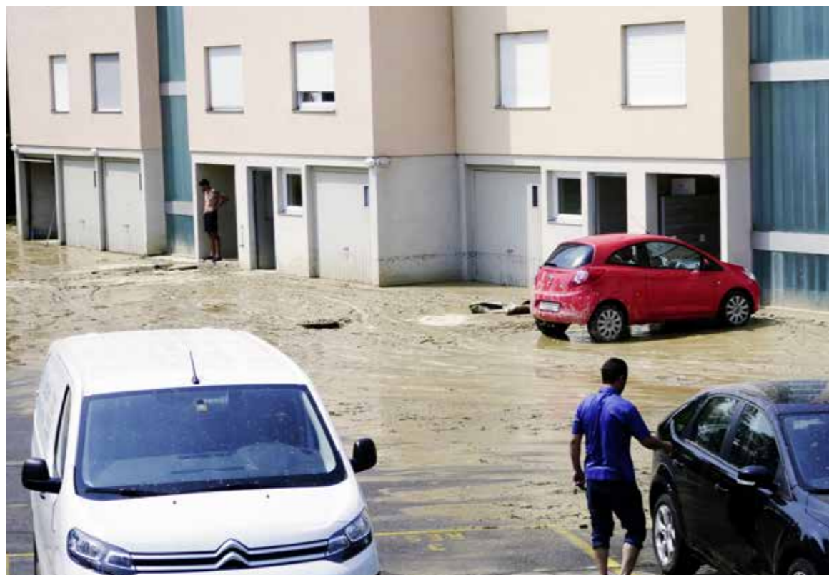
Überflutete Keller und viel Schlamm am Morgen nach dem Unwetter.