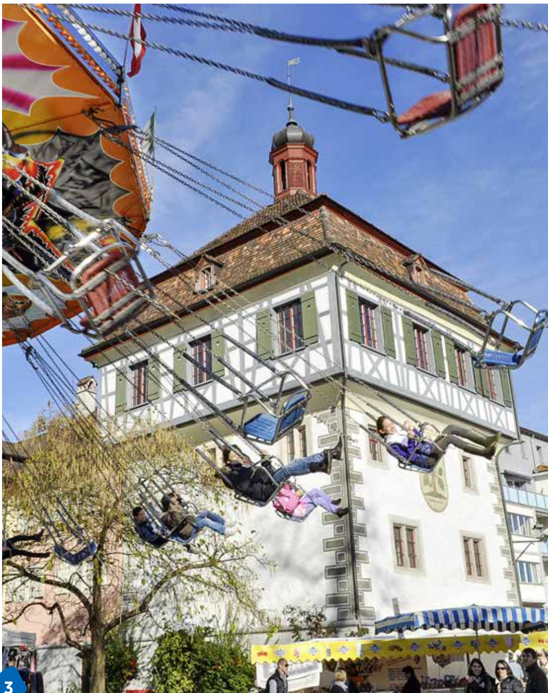
3 Ein Bild aus besseren Jahrmarkt-Tagen: Kettenkarussell vor dem Rathaus Arbon