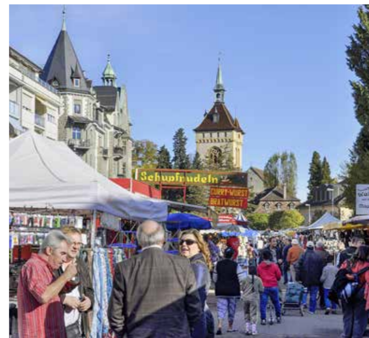
Zwischen Traumfängern, Schupfnudeln und Magenbrot: Kunterbuntes Durcheinander an der Arboner Promenade – ein Bild aus früheren Jahren.