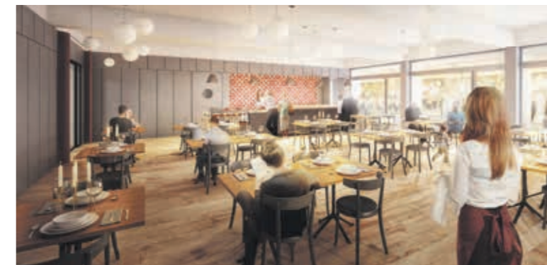
Diese Visualisierung zeigt, wie das öffentliche Restaurant aussehen soll.

Wer im «Casa Giesserei» wohnt, bezahlt für eine Zweieinhalb-Zimmerwohnung ab 2700 Franken, für die Dreieinhalb-Zimmer ab 3500 Franken. Inbegriffen sind alle Neben- und Heizkosten, Strom, Veranstaltungen im Hause, Sicherheitsnotruf