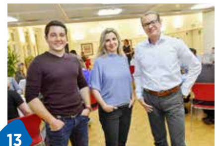
13 Von Frauenhand dirigiert