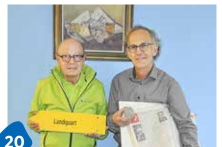
20 Objekte mit Geschichte