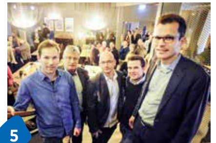
5 Die Ressorts sind verteilt