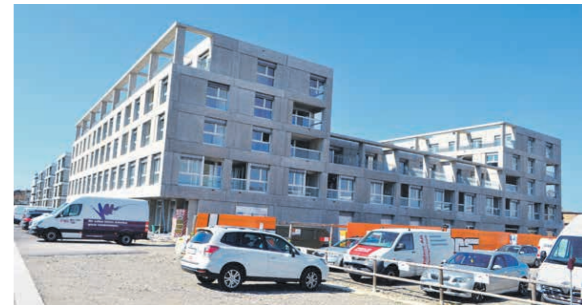
Auf dem ehemaligen Saurer-Areal: Handwerker sind derzeit mit dem Innenausbau des «Casa Giesserei» beschäftigt.

Eine der grössten Arboner Baustellen kann morgen Samstag, 23. März, von 10 bis 16 Uhr besichtigt werden: Das «Casa Giesserei» im WerkZwei. Hier entstehen 59 Wohnungen fürs Wohnen im Alter.