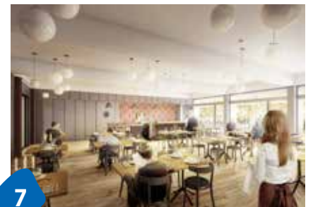
7 Senioren-Hotel im WerkZwei