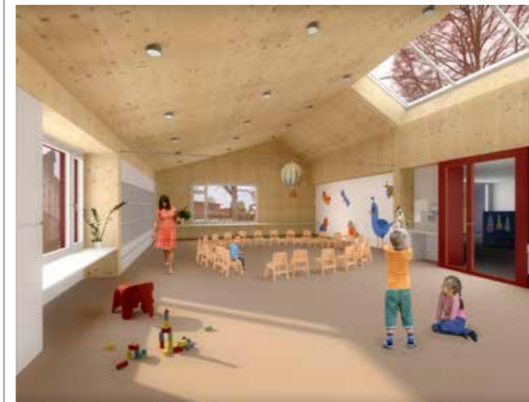
Wie diese Visualisierung zeigt, werden die Innenräume des neuen Kindergartens schlicht gehalten. Die Kinder sollen diese mit ihren Werken beleben.

Morgen Samstag kann die Baustelle des neuen Doppelkindergartens an der Thomas-Bornhauser-Strasse 30 in Arbon öffentlich besichtigt werden. Ein Jahr später als geplant, befindet sich das Projekt jetzt auf der Zielgeraden.