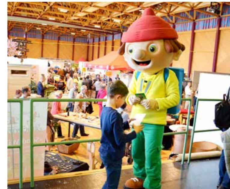
Begegnungen, Information und Genuss: Die «Messe am See», die bisher im Seeparksaal Arbon stattfand, öffnet sich und wird zur Oberthurgauer Messe.