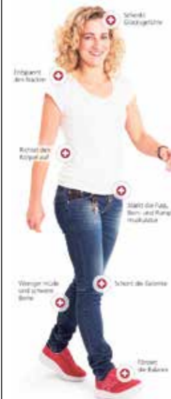
Wohlthuende Entlastung - dank kybun Joya

weitere Informationen unter: www.kybun-joya.swiss