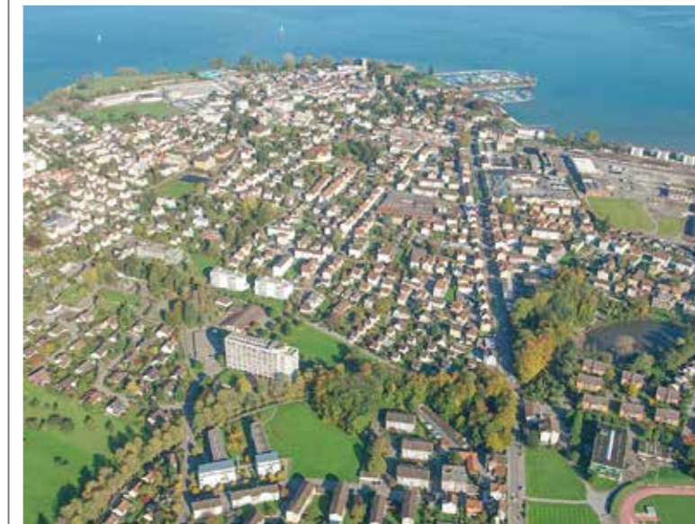
Die Stadt Arbon aus der Luft. Für die Ortsplanungsrevision wurden inzwischen Änderungen vorgenommen, diese werden im Juni öffentlich aufgelegt.

Im Juni 2021 wird das Dossier Ortsplanungsrevision zum zweiten Mal öffentlich aufgelegt. Im Vorfeld erhalten Interessierte an zwei Informationsveranstaltungen die Möglichkeit, sich von den Verantwortlichen seitens Stadt Arbon über die Änderungen orientieren zu lassen.