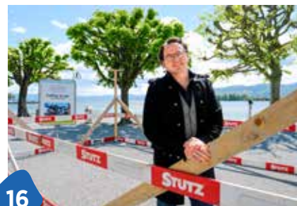
Chefwechsel bei Wälli AG