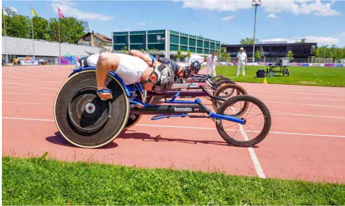
Auf die Plätze, fertig, Weltrekord! Am «Weltklasse am See» von vergangem Wochenende zeigten die Sportlerinnen und Sportler Höchstleistungen. Und dies, obwohl das Publikum coronabedingt fehlte und das Wetter nicht optimal war.