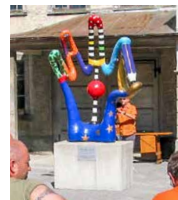
Die Skulptur «Friendly Hand» stand seit 2006 im Hinterhof des Stadthauses – jetzt ist sie entfernt worden.

Im Jahr 2006 durfte die Stadt Arbon die Skulptur «Friendly Hand» von der in Berg SG lebenden Künstlerin Sabin Aepli-Kutter übernehmen. In einem feierlichen Akt wurde die Skulptur im Hof des Stadthauses platziert. Der Platz wurde neu gestaltet und so mit den Worten des damaligen Stadtpräsidenten Martin Klöti aufgewertet, als kleiner Schritt zur Verschönerung des Städtli. Letzten Herbst nun wurde die Skulptur zur Reparatur zum Spezialisten für Kunststofftechnik gebracht, da der Sockel verschiedene Risse aufwies. Da die Reparatur 5 000 Franken gekostet hätte, entschied der Stadtrat, die Skulptur zu entsorgen. Für die Fachkommission für Kulturförderung war der Standort nicht optimal und barg Unfallgefahren, da schon Kinder auf die Skulptur geklettert seien. Dieser Tage wurde nun auch der Betonsockel, der zwi-