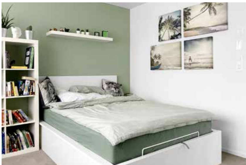
Das Schlafzimmer wie aus dem Katalog. Die Kundin wünschte sich von «Letti - ihr Maler» ein farblich aufeinander abgestimmtes Schlafzimmer.