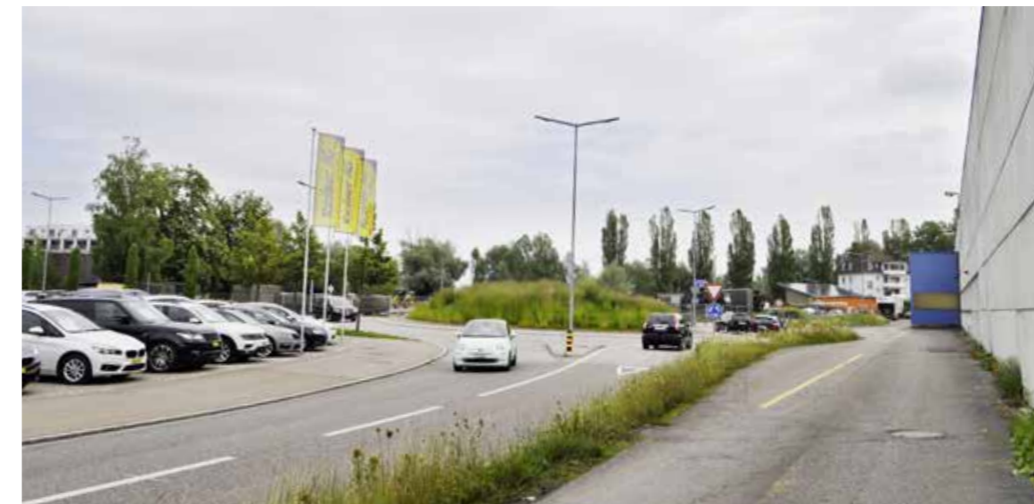
Blick auf den NLK-Kreisel an der Gemeindegrenze Arbon-Steinach: Dahinter liegt die Parzelle, auf welchem die Firma HRS das 65 Meter hohe Steinacher Hochhaus mit Gewerbeflächen und 100 Wohnungen hochziehen will.

Jetzt wird es konkret. Die Steinacher Bevölkerung muss sich der Gretchenfrage stellen: Will sie ein 65 Meter hohes Hochhaus oder nicht?