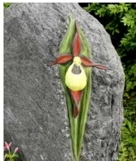
Die Malerarbeit auf dem Grabmal aus Sandstein war aufgrund des Materials eine Herausforderung.