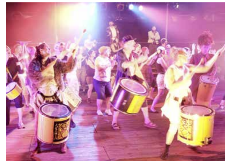
Lupinas erster grosser Fischfang wird in Steinach mit einem Fest gefeiert. Später kippt die Stimmung und der unverhoffte Fischsegen ruft Neider auf den Plan.