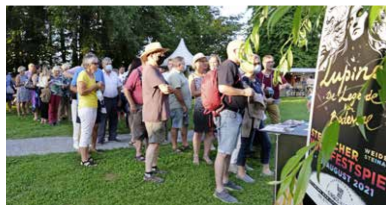
Schlange stehen vor Aufführungsbeginn: An der Premiere von «Lupina – Die Legende vom Bodensee» sind die Ränge im Zirkuszelt restlos besetzt.

Das Stück ist ein ständiges Hoch und Tief der Gefühle. Hass, Liebe, Trauer, Freude folgen dicht aufeinander und fordern das Publikum heraus, während gleichzeitig mit artistischen Einlagen, Gesang und Musik alle Sinne angesprochen werden. Komik und Tragödie geben sich die Klinke in die Hand. Am Ende feiert das Dorf seine wiedergewonnene Einheit. Der Zuschauer jedoch bleibt mit der Frage zurück, ob der Preis die Einheit wert war. Das Stück ist es auf jeden Fall. kim