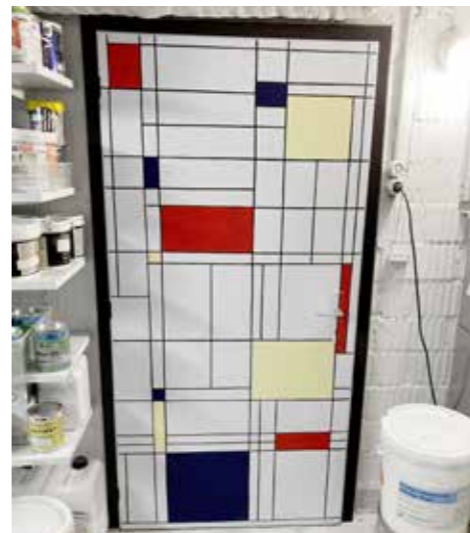
Warum nicht das Werk des Lieblingskünstlers an der Türe verewigen?