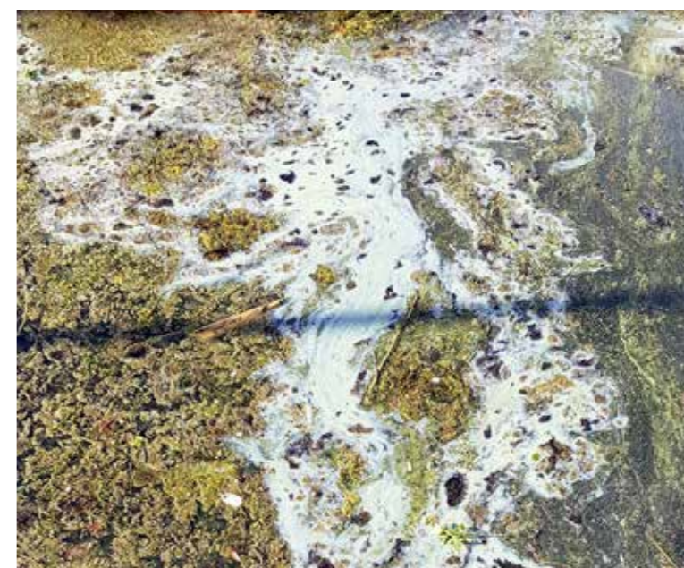
Deutlich sichtbar: Die Blaualgen im östlichen Horner Hafenbecken.

Im östlichen Hafen der Gemeinde Horn sind vergangene Woche blaue Verfärbungen an der Wasseroberfläche festgestellt worden. Untersuchungen des Amts für Umwelt des Kantons Thurgau haben gezeigt, dass es sich um toxische Blaualgen handelt.