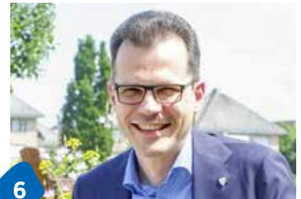
Gastro am See kann starten