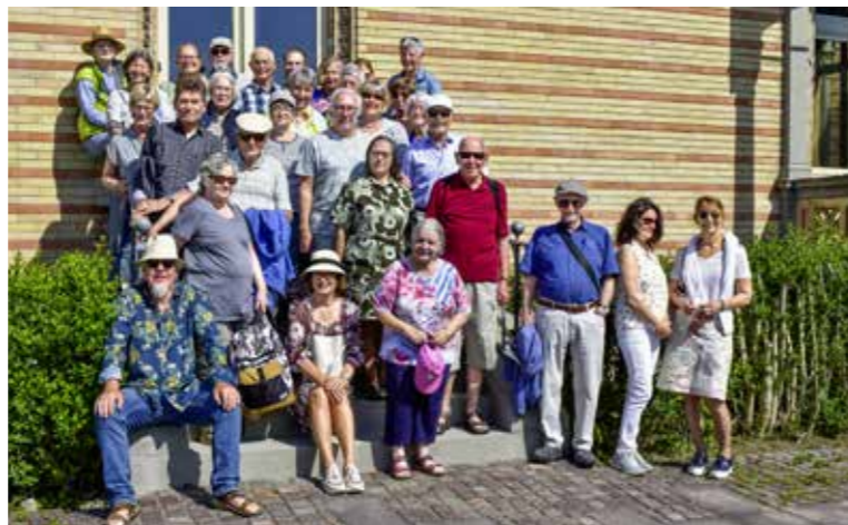
Die «felix.»-Reisegruppe vor dem Schloss Montfort.

Erstmals führte eine «felix.»-Leserfahrt die 12,27 Kilometer lange Strecke über den See nach Langenargen, der Partnergemeinde von Arbon. Bürgermeister Ole Münder begrüßte seine 34 Gäste persönlich im Schloss Montfort. Sie erlebten Langenargen danach hörend, sehend und geniessend: auf einem historischen Spaziergang, bei der Mittagspause im Gasthof Krone, dem Besuch des kleinen