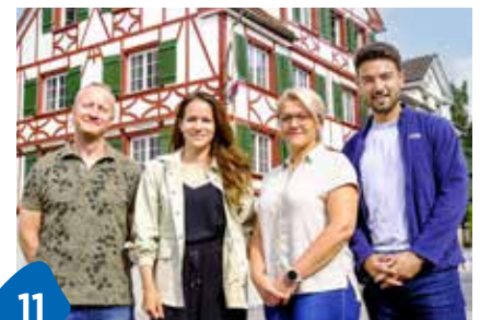
Hoteleröffnung steht bevor