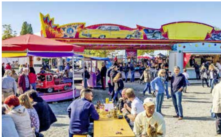
An der Horner Seepromenade lässt es sich beim Seefest gut verweilen.

Vom Jass-Turnier zum Gottesdienst Nicht nur die Kinder kommen auf ihre Kosten. Am Samstag beginnt um 10.15 Uhr das Jass-Turnier, welches