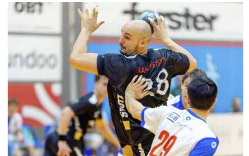
Können sich die Arboner gegen den Tabellenführer durchsetzen?

Nach dem Sieg gegen GC Amicitia und der Niederlage gegen den Nati-A Absteiger RTV Basel empfängt der HCA im dritten Heimspiel in Folge mit der GS Stäfa den souveränen Tabellenführer. Die Zürcher sorgen nicht nur in der Liga für Furore, sondern haben mit dem Cup-Sieg gegen den HC Kriens auch den Titelverteidiger aus der Nati A eliminiert. Doch dies ist kein Grund für die Arboner, nicht an ihre Chance zu glauben. Das Banic-Team zeigt im Verlaufe der Saison eine konstante Leistungssteigerung und