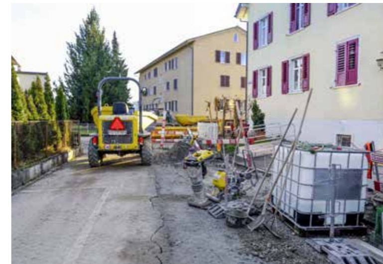
Ist das städtische Vergabeprozedere transparent genug?