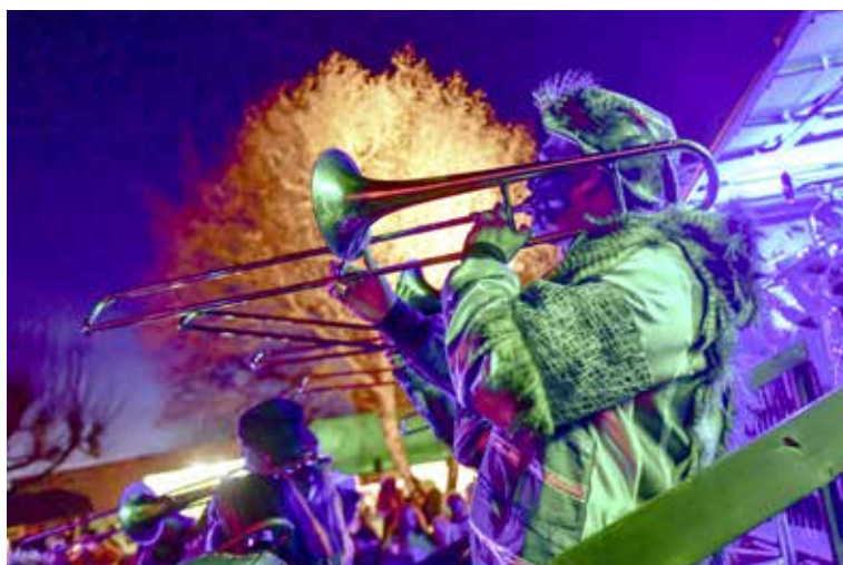
Stimmungsvolles Ambiente auf dem Steinacher Schulhausplatz mit Guggenmusik am laufenden Band.