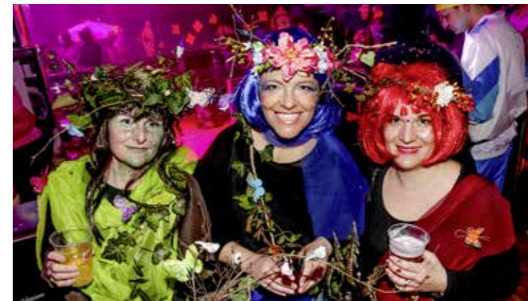
Verkleiden ist in, Fasnacht nicht so. Das soll sich in Arbon nun ändern.