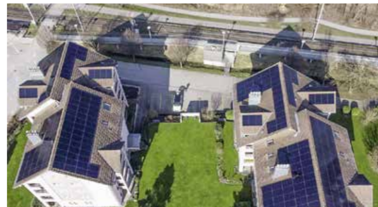
An der Messe am See berät die «CE Concept Energy» Interessenten über die Installation von Photovoltaikanlagen und weiteren Energiesystemen.

Die CE Concept Energy AG aus Roggwil behält für ihre Kundschaft den Überblick über die neuesten Trends rund um das Thema erneuerbare Energie. Interessierte Besuchende können sich am Stand an der «Messe am See» zur neusten Generation von Photovoltaikanlagen,