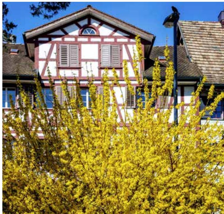
Pünktlich zu Ostern sorgen die ersten Frühlingsboten für bunte Tupfer in den Gärten und auf den Wiesen. Häbi Haltmeier