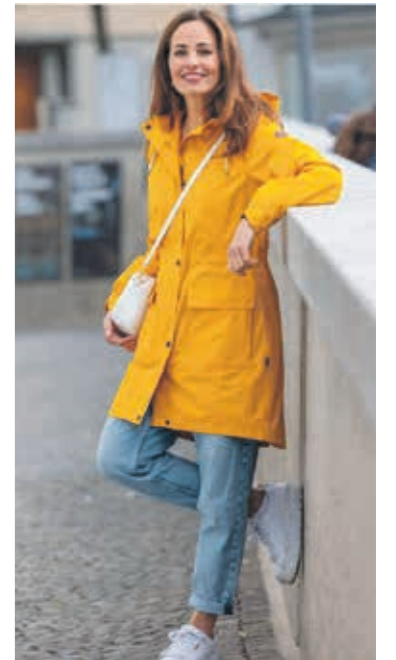
«Outdoor Store» präsentiert an der Messe am See den neusten Frühlingstrend in einer Modeshow.

Der «Outdoor Store» in Steinach bietet ein breites Sortiment an Outdoor-, Sport- und Freizeitmode von «Rukka» an. An der «Messe am See» präsentieren sie die neusten Frühlingstrends des Schweizer Kleiderherstellers in einer Modeshow. Wie immer steht dabei Funktionalität kombiniert mit Wetterfestigkeit im Fokus. Die Modeshows finden morgen Samstag, 23. März, um 10.30 und 14 Uhr sowie am Sonntag, 24. März, um 10.30 und 15.30 Uhr statt. Der «Outdoor Store» lockt die Besuchenden der «Messe am See» aber auch aus anderen Gründen in den Seeparksaal Arbon. Ergänzend wird eine Auswahl an Damen Secondhand-Mode präsentiert und am Glücksrad können verschiedene Preise ergattert werden. Alle Käuferinnen und Käufer erhalten zudem einen Fixrabatt von 20 Prozent auf das gesamte Rukka-Sortiment. pd