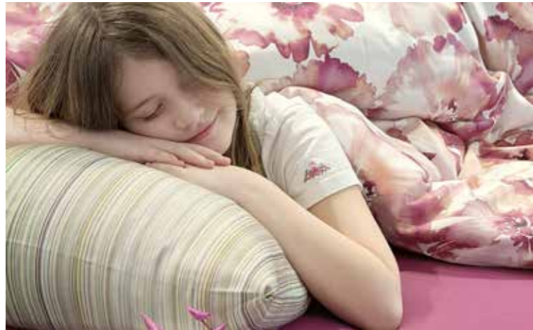
«Feger – Wohnen nach Mass» sorgt für erholsamen Schlaf.