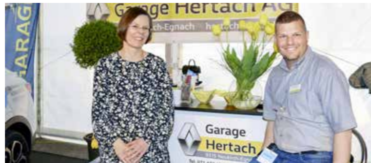
Der Renault und Dacia Spezialist «Hertach AG» informiert an der Messe am See über die neusten Modelle.