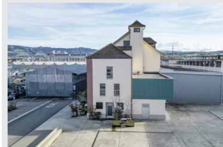
Der Platz vor der Stirnseite der Webmaschinenhalle soll im Rahmen eines Wettbewerbs künstlerisch aufgewertet werden.

bleibe bis zur Sanierung der Halle für das «Museum Werk2» weiterhin unbeheizt. «Die musealen Bedingungen sind ideal, das ist uns bewusst», weiss Philipp Kuhn, Leiter des Kulturamts Thurgau. Sie seien deshalb offen für unterschiedliche Nutzungen des Raumes: nicht nur Ausstellungen, auch Theater oder Musikveranstaltungen seien vorstellbar. Während sich also im ersten Obergeschoss der Webmaschinenhalle die Nutzerinnen und Nutzer über die nächsten Jahre abwechseln werden, sollen die aktuellen Mieterinnen und Mieter bis zur Realisierung des «Museum Werk2» bleiben können, «sofern dies mit den Zwischennutzungen kompatibel ist», so Regierungsrat Dominik Diezi. Um die Webmaschinenhalle auch von aussen aufzuwerten, soll noch dieses Jahr ein Gestaltungswettbewerb stattfinden, mit welchem «eine künstlerische Intervention für eine Attraktivitätssteigerung sorgen soll», so Roland Ledergerber. Der Platz westlich der Webmaschinenhalle soll durch eine künstlerische Gestaltung zum Anziehungspunkt auf dem Areal werden. Das «Herzstück», wie Roland Ledergerber die Webmaschinenhalle nennt, soll auch als solches erkennbar sein.