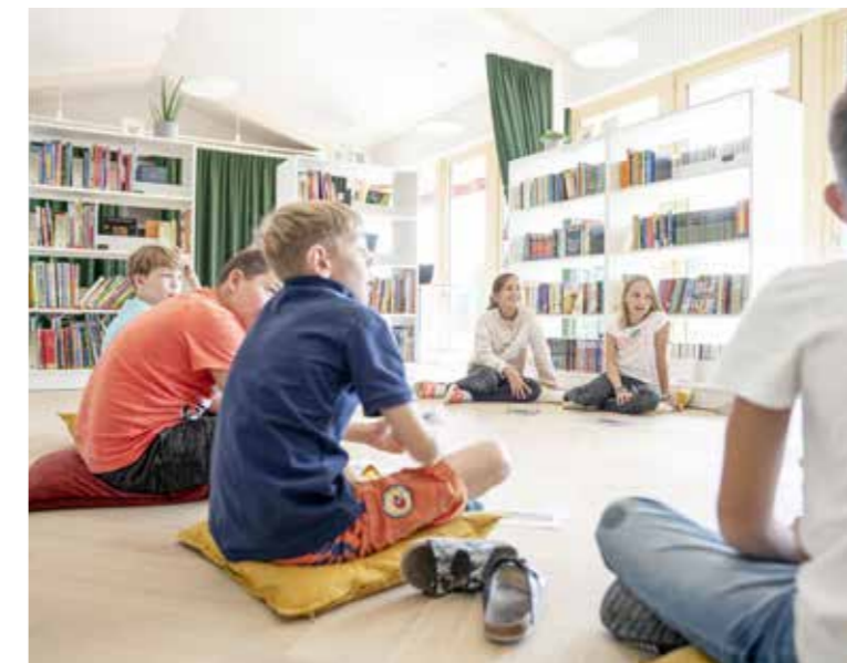
Die Schullergänzende Betreuung ist ein wichtiger Pfeiler zur Vereinbarkeit von Familie und Beruf. Symbolbild