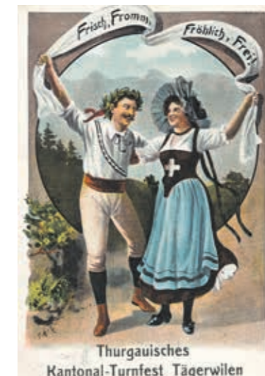
Am Thurgauer Kantonaltturnfest in Tägerwilen 1911 sind Frauen erstmals nicht nur in Tracht, sondern auch als Turnerinnen vertreten. z.V.g.

Was 1874 in Bischofszell mit 185 Turnern beginnt, mausert sich zum grössten Schweizer Sportanlass 2024: das Thurgauer Kantonaltturnfest. 7400 Turnende kommen am diesjährigen Wettbewerb Ende Juni in Arbon zusammen. Doch das Turnfest ist nicht nur ein sportliches Ereignis, sondern ein Spiegel des gesellschaftlichen Wandels, wie Historikerin Dr. Petra Hornung am Museumshäppli vom Donnerstag, 28. März 2024, aufzeigt. Am kostenlosen Kurzvortrag um 12.30 Uhr im Schloss Frauenfeld wirft sie einen Blick auf die von Krisen, Krieg und gesellschaftlichen Veränderungen bewegte 150-jährige Geschichte des Thurgauer Kantonaltturnfests. Es wird um eine Anmeldung unter www.historischesmuseum.tg.ch gebeten. pd