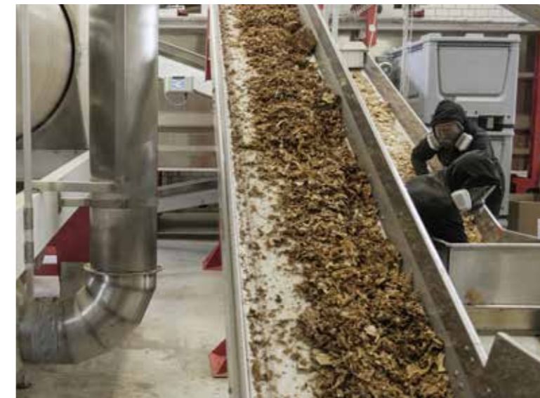
In den Produktionshallen in Steinach wird wieder gearbeitet.