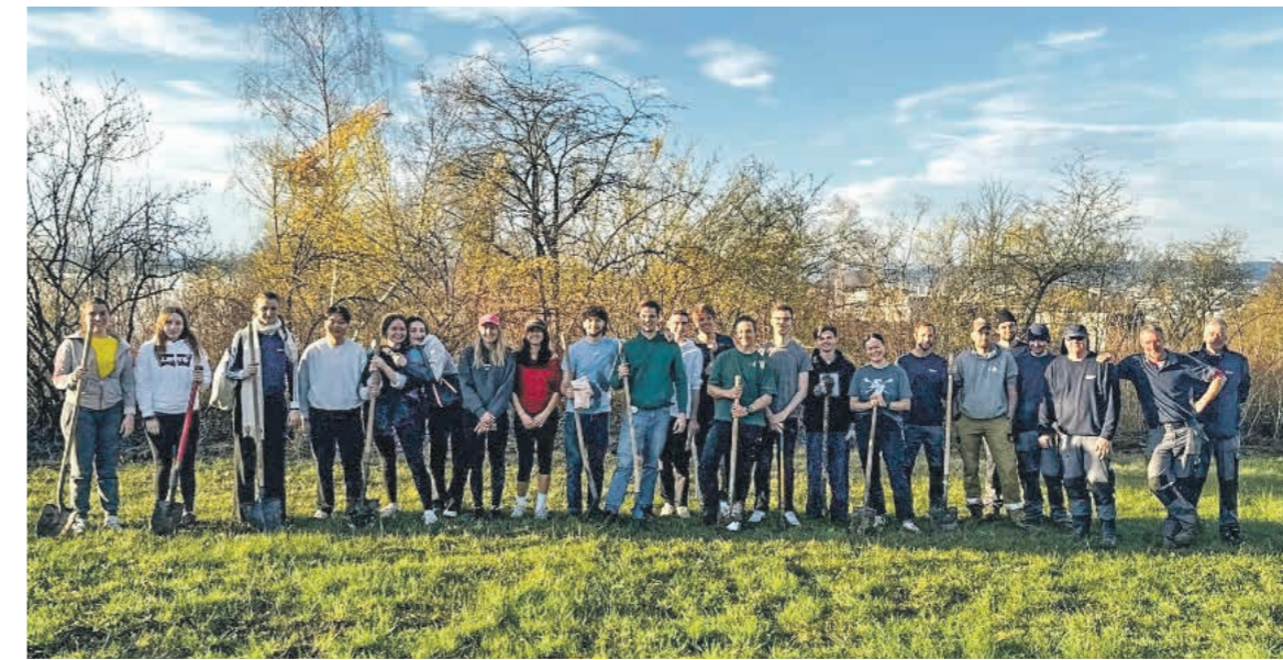
Letzte Woche durfte der Verein Arbor Mundi an der Universität Zürich bereits ein Baumpflanz-Projekt realisieren.