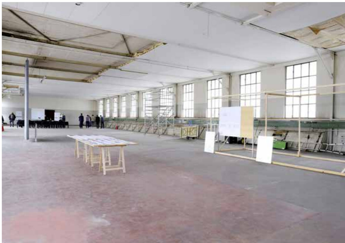
Auf diesen rund 400 Quadratmetern sollen ab Dezember 2024 Zwischennutzungen unterkommen.

Fakt ist: Im Jahr 2025 werden dem Kanton Thurgau aufgrund der prognostizierten ausbleibenden Ausschüttungen der Schweizerischen Nationalbank (SNB) sowie des rückläufigen Betrags aus dem Neuen Finanzausgleich (NFA) des Bundes rund 200 Millionen Franken in der