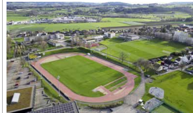
Vom neuen Kunstrasen auf der Sportanlage Stacherholz wird nicht nur der FC Arbon 05 profitieren.