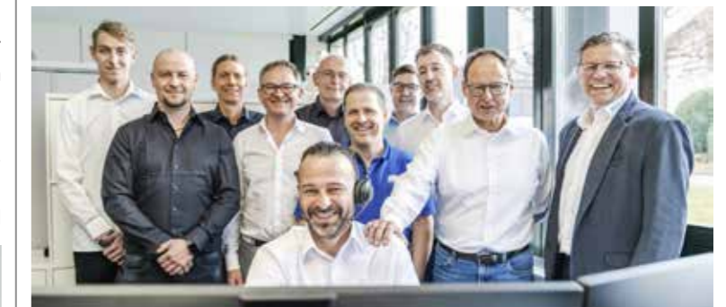
Das Backoffice-Team der «Klimamacher» ist der erste Ansprechpartner für ihre Kundinnen und Kunden.

Die Gebäudetechnik spielt beim nachhaltigen Bauen und Sanieren eine tragende Rolle. Es gibt etliche Möglichkeiten, in den eigenen vier Wänden Energie zu sparen, wie Heizungs-, Lüftungs-, Klima- oder Sanitäreanlagen (HLKS). Die Frage ist nur, wo man ansetzt und wie man das Ganze umsetzt. Antworten darauf liefert die «Klimamacher AG»,