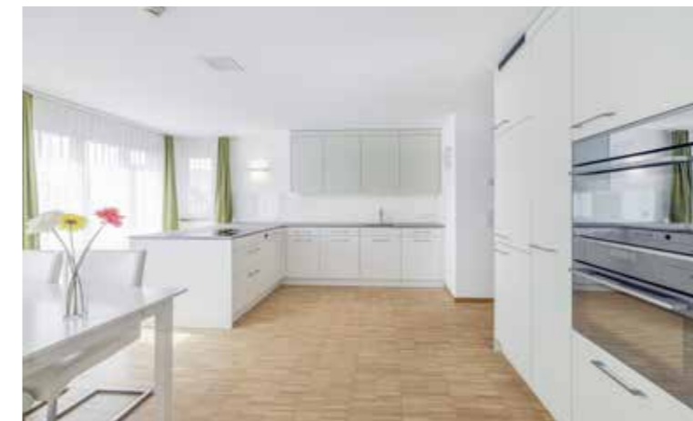
So kann eine Küche aussehen, die von «Kaufmann Oberholzer» gestaltet wird.

der Holzverarbeitung ab und bietet sämtliche Dienstleistungen aus einer Hand – von der kleinen Reparatur am «Chuchichästli» bis zur umfassenden Beratung und Umsetzung von Renovations-, Küchenerneuerungs-, Ersatzneubau- oder Mehrfamilienhausprojekten. pd