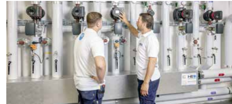
Die Mitarbeitenden der Haustechnik Eugster AG sorgen dafür, dass das Zuhause effizient und umweltfreundlich beheizt wird.