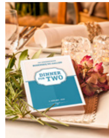
Mit «Dinner for two» doppelt geniessen und einmal bezahlen.

Wer auf der Suche nach einem Weihnachtsgeschenk für einen Feinschmecker oder eine Feinschmeckerin ist, könnte mit dem Genussbüchlein «Dinner for two» ins Schwarze treffen. Wer Glück hat, kann ein Exemplar davon bei der «felix.»-Verlosung gewinnen.