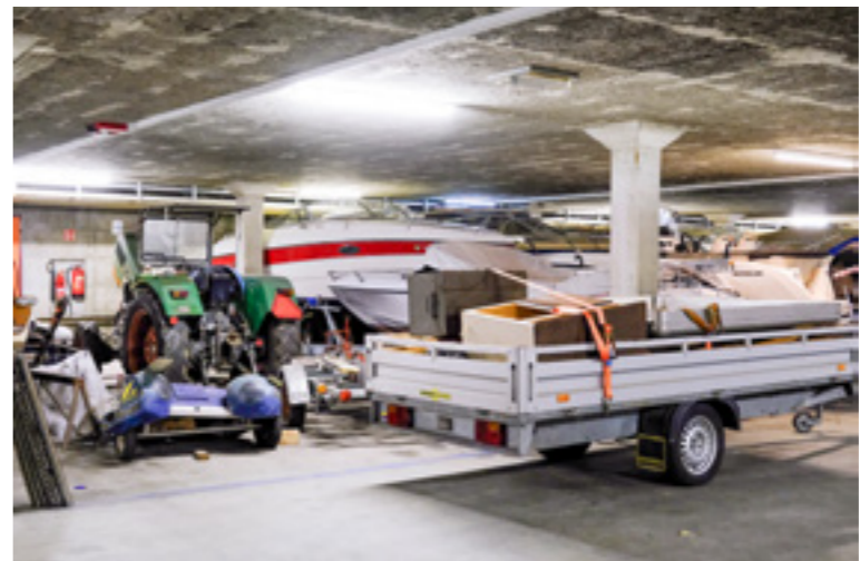
Boote, Traktoren, Materiallager – die heutige Nutzung der Tiefgarage verstösst gegen den Brandschutz. 100'000 Franken sind 2026 für die Massnahmen budgetiert.