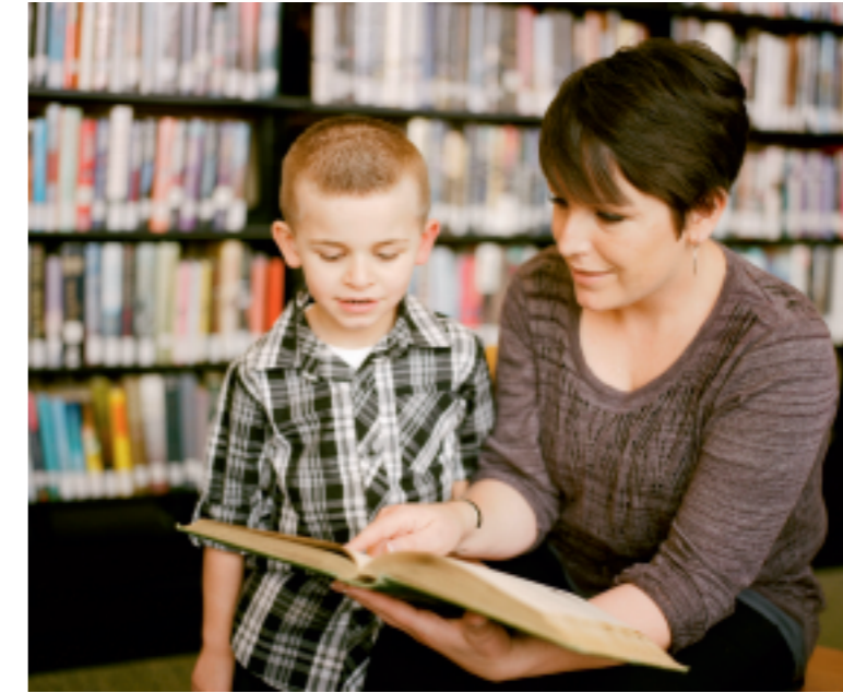
Gezielte Sprachförderung erleichtert Kindern mit geringen Deutschkenntnissen den Einstieg in den Schulalltag. Symbolbild: unsplash

Kosten sparen dank Früherkennung Von einer Ungleichbehandlung im neuen Förderprogramm zu sprechen greift für Hiller und Stacher zu kurz. «Grundsätzlich kann jede Fördermassnahme im Bildungsbereich als Ungleichbehandlung eingestuft werden, dazu würden dann auch