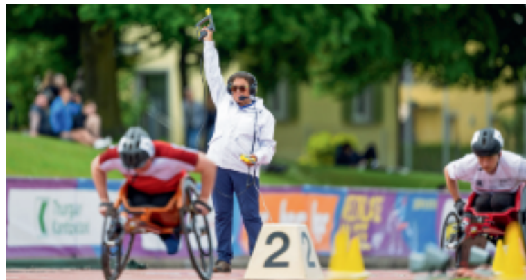
Am 14., 16. und 17. Mai findet das Weltklasse am See in Arbon statt.

«Die Sanierung der Sportanlage bedeutet, dass in den nächsten Jahren