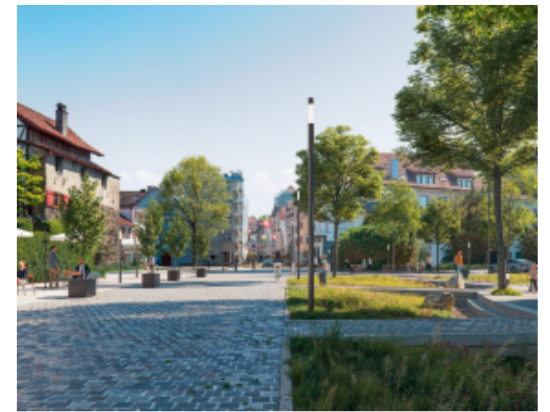
Die Neugestaltung der Altstadt beinhaltet unter anderem zusätzliche Grünflächen und die Aufwertung der Aufenthaltsräume.

Ein zentrales Element ist die ökologische Aufwertung mit zusätzlichem Grünraum. Entsiegelte Flächen, Versickerungszonen und Baumpflanzungen folgen dem Prinzip der «Schwammstadt» und verbessern das Regenwassermanagement ebenso wie das Mikroklima. Die Gestaltung respektiert das historische Ortsbild von nationaler Bedeutung. Hochwertige Materialien, gepflasterte Plätze und eine zurückhaltende Lichtinszenierung stärken die Identität des Stadtkerns.