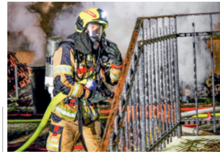
Die Feuerwehren Arbon und Roggwil planen einen Feuerwehrverbund.