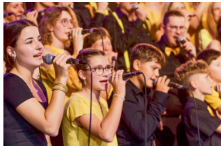
Der Chor Amazonas Kids & Juniors steht für Gemeinschaft, musikalische Qualität und vor allem für Spass am gemeinsamen Singen.

Singbegeisterte Kinder und Jugendliche aus der Region haben an zwei Samstagen im März die Gelegenheit, unverbindlich Chorluft zu schnuppern. Am 14. und 21. März öffnet der Chor Amazonas seine Türen an der Gallusstrasse 5b in Steinach für alle, die Freude am Singen haben – eine Voranmeldung ist nicht erforderlich. Für Kinder ab sieben Jahren findet an beiden Tagen jeweils um 10.30 Uhr ein einstündiger Sing-Workshop statt. Spielerisch und mit viel Begeisterung