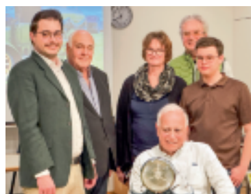
Der neue Vereinsvorstand.