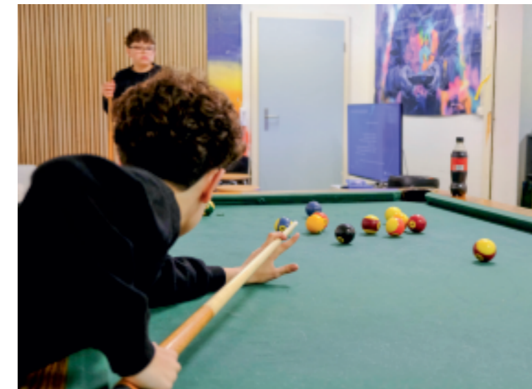
Zwei Jungs spielen gemeinsam Billard im Jugendtreff.