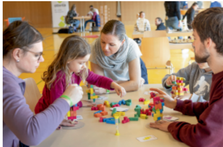
Jung und Alt treffen sich in Roggwil zum Spielen.

Dieses Wochenende findet die vierte Ausführung der «Roggspiel» statt. Einmal mehr wird morgen Samstag, 21. März, von 11 bis 22 Uhr und Sonntag, 22. März, von 9 bis 17 Uhr in der Turnhalle Roggwil entdeckt, gespielt, geknobelt und geforscht. Rund um das Thema Spielen bietet der zweitägige Anlass ein vielseitiges und spannendes Programm. Es können über 50