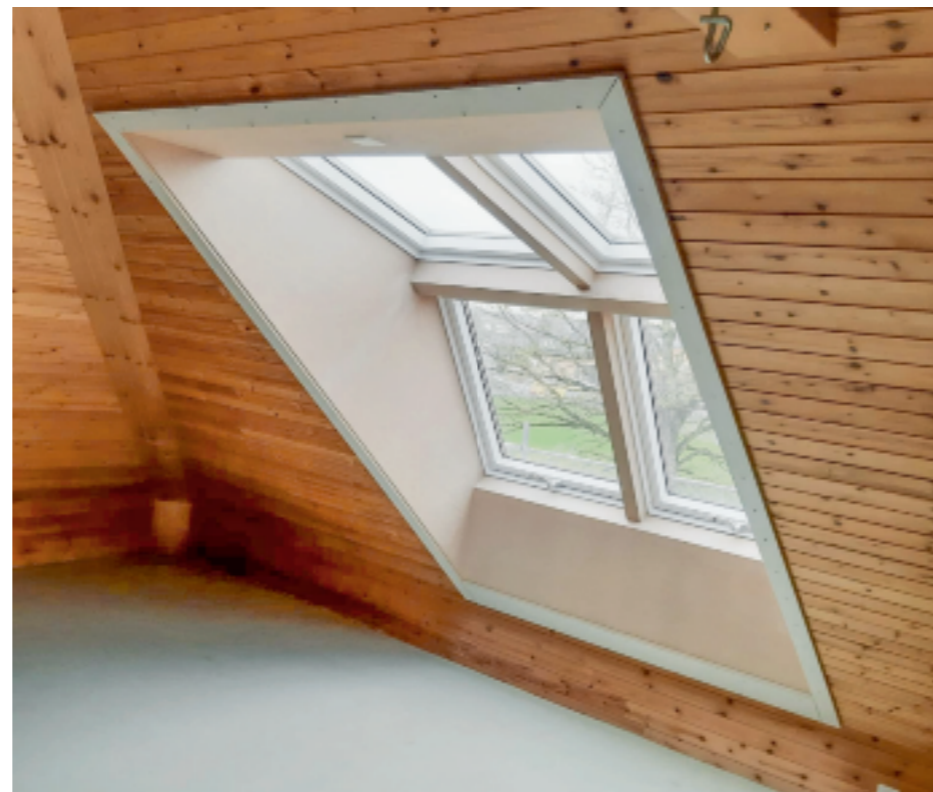
Die Hubmann Dach- und Fassadenbau AG bietet an der GEWA einen Einblick in alle Arbeiten und Services rund ums Dach.

Was bieten Sie in diesem Jahr an Ihrem Stand an? In diesem Jahr möchten wir den Fokus auf die Dachfenster legen. Vielen ist nicht bewusst, dass ein Dachdecker auch alle Arbeiten in