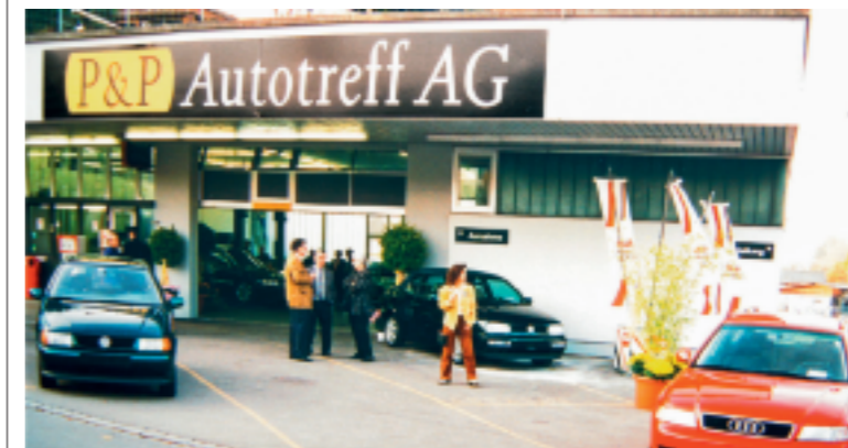
Ein Bild aus den Anfangszeiten des PP Autotreffs.