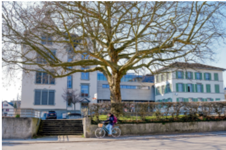
Der Verkauf des Reben 4 wird das Budget der SSGA weiter entlasten. //k

Grund für den massiv besseren Abschluss ist der Fiskalertrag, der um 2'304'130 Franken höher ausfiel. Beim Steuerertrag stützt sich die SSGA auf die Prognosen der Stadt Arbon und der Gemeinde Roggwil ab. Dass diese derart übertroffen wurden, liegt insbesondere auch daran, dass die kantonalen Steuerbehörden mit den Veranlagungen nach wie vor sehr in Verzug sind. So gingen für das laufende Jahr aus Arbon 845'896 Franken mehr ein und aus den Vorjahren 962'997 Franken (Roggwil: plus 230'431 Franken) sowie Quellensteuern plus 218'453 Franken. Neben dem Steuerertrag hat zum hohen Gewinn beigetragen, dass unter anderem der Personalaufwand mit 577'949 Franken (wegen der Nichteröffnung