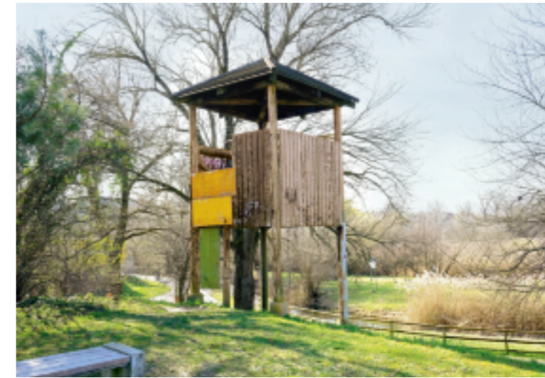
Die Tage des Holzturns bei der «Ufshütti» in Arbon sind gezählt. //k