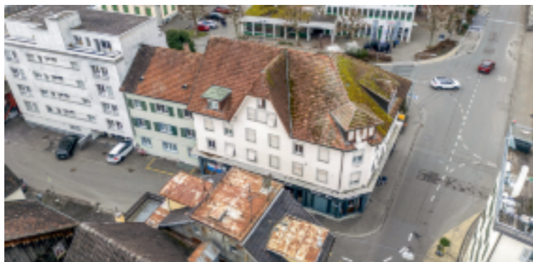
Der ehemalige Wäschereibetrieb im Obertor führte zu Bodenverunreinigungen. Kevin Fitzi

Ab dem 23. März führt die Stadt Arbon im Gebiet rund um die Rathausgasse 13 weitere Altlastenuntersuchungen durch. Ziel ist es, die Ausbreitung von chlorierten Kohlenwasserstoffen (CKW) im Untergrund genauer zu bestimmen. Am besagten Standort wurde von Ende der 1960er-Jahre bis 2014 eine chemische Reinigung betrieben. Untersuchungen in den Jahren 2022 bis 2024 zeigten deutliche CKW-Belastungen im Untergrund bis in rund sechs Meter Tiefe. Zudem wurde festgestellt, dass sich die Belastung in grösserer Tiefe über das Standortgrundstück hinaus