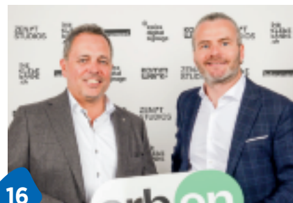
HCA ist auf Aufstiegskurs