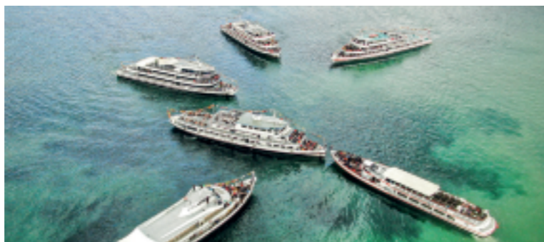
Die Internationale Flottensternfahrt ist ein erster Saisonhöhepunkt.

Die Vereinigten Schifffahrtsunternehmen für den Bodensee und Rhein (VSU) eröffnen die Schifffahrtssaison 2026 offiziell morgen am Karfreitag, 3. April. Zum Auftakt lädt die Weisse Flotte Einheimische und Gäste ein, den Bodensee wieder vom Wasser aus zu erleben und gemeinsam in die neue Saison zu starten. Ein erster Höhepunkt folgt am Samstag, 25. April, mit der 53. Internationalen Flottensternfahrt. Sieben Schiffe aus Deutschland, Österreich und der Schweiz formieren sich auf dem Bodensee zur eindrucksvollen Sternfahrt und sorgen