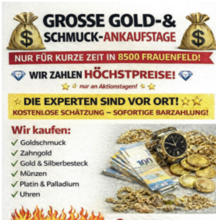
Bei Kontrollen von Altedelmetall-Ankäufern hat die Kapo Thurgau diverse Gesetzesverstösse festgestellt. Dieser Flyer ist ein KI-generiertes Symbolbild. kapo

Die Kontrollen der Kriminal- und Regionalpolizei fanden seit vergangenerm November in mehreren Gastronomiebetrieben statt. Dort hatten sich Ankauf von Altgold und anderen Edelmetallen jeweils für einige Stunden eingemietet. Bei mehr als der Hälfte aller Veranstaltungen konnten Gesetzesverstösse festgestellt werden. So kamen teilweise Waagen ohne die vorgeschriebene Prüfung und Eichung zum Einsatz. Ebenso wurden teils unvollständige oder gar keine Quittungen ausgestellt oder diese nachträglich verändert. Einige Kontrollierte waren nicht im Besitz der erforderlichen Bewilligung. Die fehlbaren Ankauf wurden bei der Staatsanwaltschaft zur Anzeige gebracht. Ausserdem hat die