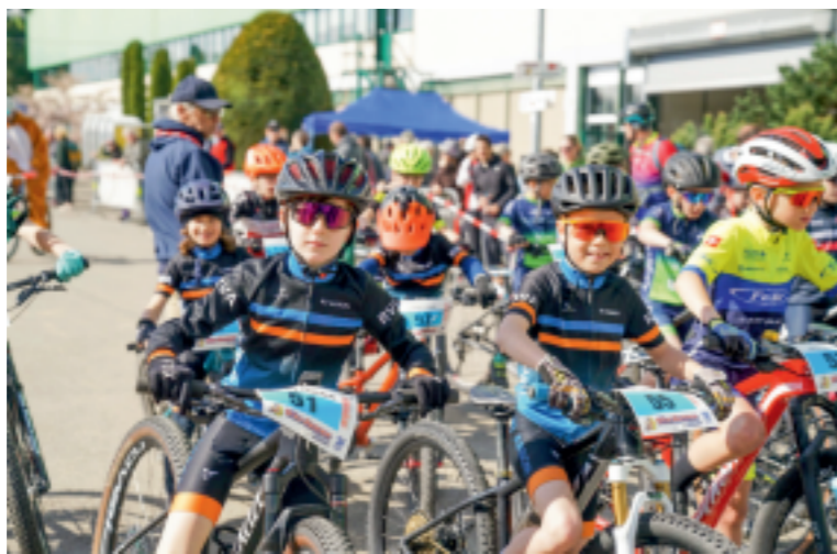
Gespanntes Warten auf die Startfreigabe.

Der Wechsel zwischen Wald- und Wiesenpartien, schnellen Singletrails und vielen Richtungsänderungen lässt für die Sportlerinnen und Sportler keine Erholungsphase zu. Für das Publikum wiederum ist dadurch Hochspannung garantiert. Vom Start- und Zielgelände aus sind einzelne Streckenabschnitte gut sichtbar und mit einem kleinen Spaziergang können sich die Zuschauenden vom technischen