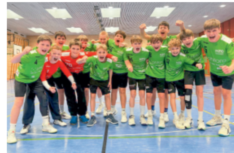
Spielen am Samstag das Finalspiel um den Schweizer Meistertitel: Die MU13 des Handball Zentrum Ostschweiz (HZO)

Morgen Samstag wird die Kybunhalle zum Hexenkessel. Erst spielt die Elite U13-Team des Handball Zentrum Ostschweiz um den Schweizer Meistertitel. Danach tragen die HCA-Damen der SPL ihr letztes Heimspiel zum Kantonalderby aus und als krönender Abschluss absolvieren die HCA-Herren das erste Heimspiel der Finalrunde.