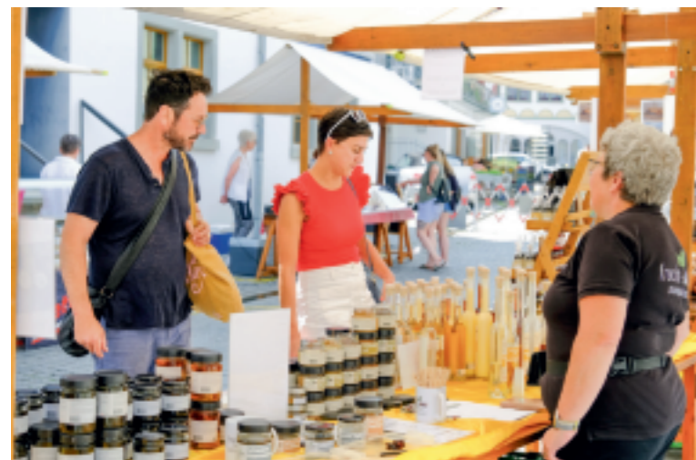
Der Arboner Wochenmarkt lädt von Ende April bis September wieder zum Einkaufen, Flanieren und Verweilen ein.

Morgen Samstag, 25. April, startet der Arboner Wochenmarkt in die neue Saison. Auf dem Storchplatz in der Arboner Altstadt verkaufen regionale Produzenten jeweils am Samstag von 9 bis 13 Uhr regionale Gemüse, frische Backwaren und Floristik aus Arbon und laden ein, Käsevariationen aus der Ostschweiz kennenzulernen. Fleisch- und Joghurtliebhaber kommen bei Wetters Spezialitätenwelt auf ihre Kosten. Auch dieses Jahr gibt es wieder an jedem Samstag ein wechselndes Mittagsangebot. Ergänzt wird der Markt wie gewohnt durch regelmässig wechselnde Aussteller aus Arbon und Umgebung. Hinzu kommen von Zeit zu Zeit Wein- und