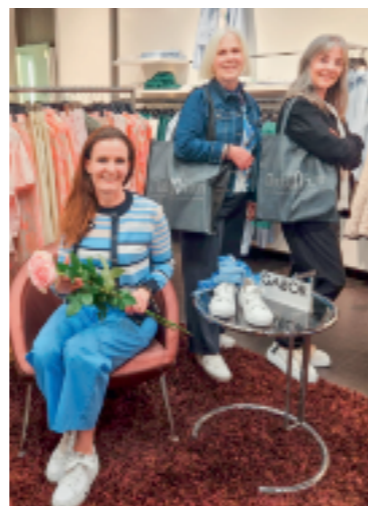
In Arbon und Roggwil sagen 23 Fachgeschäfte Danke mit einer Rose – mit dabei «Mode IN Arbon».

23 Fachgeschäfte sagen Danke: Am Rosensamstag, 25. April, erhält jede Kundin und jeder Kunde eine Rose – als Zeichen der Wertschätzung für den Einkauf vor Ort. Denn Einkaufen im Fachgeschäft ist mehr als nur ein Kauf; es bedeutet persönliche Beratung, Qualität und Begegnungen – und stärkt die Region, ihre Arbeitsplätze und ein lebendiges Miteinander. Am Rosensamstag mit dabei sind: Im Hamel art of optic und Kybun Joya Center, in der Novaseta Boutique Adesso und Lieblingslook, in der Altstadt Bestcom, Coiffeur Impuls, Filati Mode mit Wolle, Freude schenken, Iliazi Nähservice, Lula Brocki Treff, nachtragend, Natürli, Optiker Mayr, Rosenquarz, The Bloom, UNIKAT Designermode, im Rosengarten Mode In Arbon und swidro Drogerie, an der Bahnhofstrasse Boutique am See und TUI Reisedealer, an