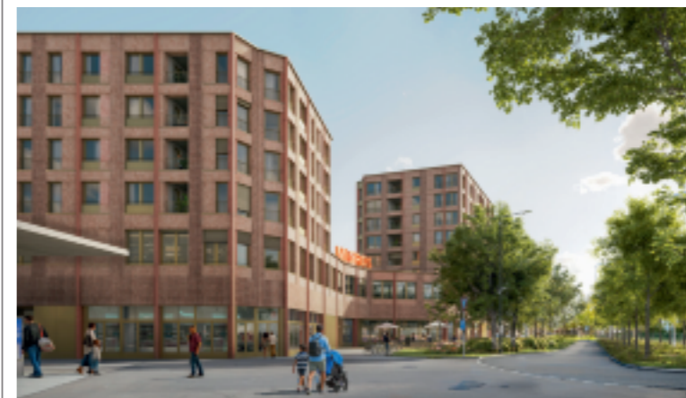
Das Überbauungsprojekt «Stadthof» ist der Umsetzung ein Schritt näher. z.V.G.