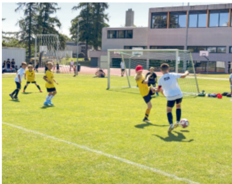
Gross und Klein zeigen im Juni ihr Fussballkönnen im Stacherholz.

Am Freitag und Samstag, 12. und 13. Juni, erwartet die Besucherinnen und Besucher ein abwechslungsreiches Programm für Gross und Klein, für Fussballbegeisterte und alle, die einfach ein geselliges Fest erleben möchten. Den Auftakt macht am Freitagabend das beliebte «Chästurnier». Hier stehen nicht Resultate, sondern der Spass im Vordergrund. Ob Familien, Firmen oder Freundesgruppen, alle sind willkommen, gemeinsam auf dem Platz ihr Können zu zeigen und einen unterhaltsamen Abend zu verbringen. Für das «Chästurnier» besteht die