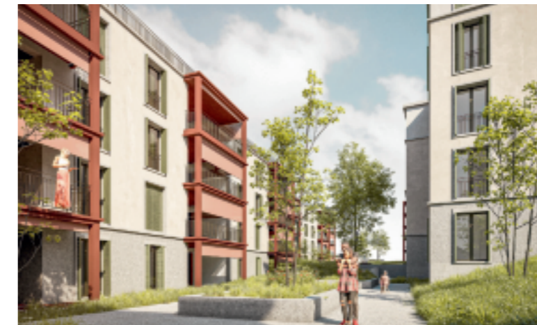
Die neue Überbauung an der Obstgartenstrasse soll mehr Grünfläche bieten. z.Vg.

Es geht Schlag auf Schlag: Keine zwei Wochen nachdem die Leerkündigungen in der Obstgartenstrasse in Arbon publik wurden, liegt jetzt das Baugesuch öffentlich auf.