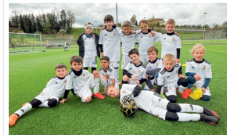
Nachwuchstalente beim «Real Madrid Trainingscamp 2026» in Tübach. z.V.g.

Ein Hauch von internationalem Spitzenfussball wehte kürzlich durch die regionalen Sportanlagen Kellen in Tübach, wo das «Real Madrid Trainingscamp 2026» stattfand. Die teilnehmenden Jungs und Mädchen aus der Region Ostschweiz zeigten eindrucksvoll, welches Potenzial und welche Leidenschaft