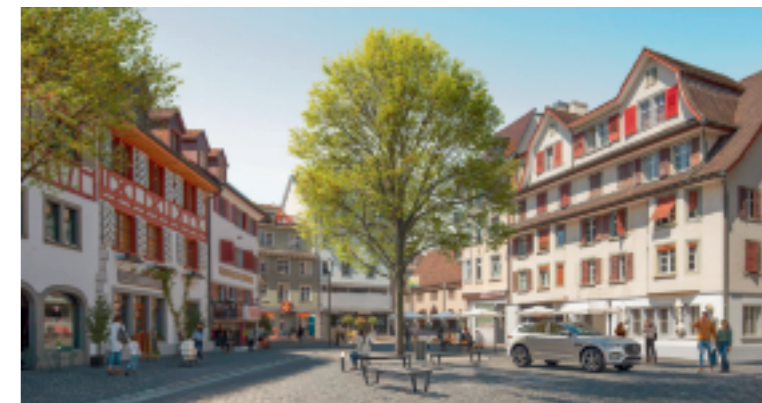
Die Visualisierung zeigt den Marktplatz nach der Aufwertung.

Am 8. März haben die Stimmberechtigten der Stadt Arbon dem Kredit für die Aufwertung der Haupt- und Promenadenstrasse mit deutlicher Mehrheit zugestimmt. Nun steht mit der öffentlichen Projektauflage der nächste Meilenstein an. Aufgelegt werden die Teilprojekte zur Sanierung und Aufwertung der Hauptstrasse, der Promenadenstrasse West sowie der Promenadenstrasse Süd. Parallel dazu läuft das Einwendungsverfahren zur Verkehrsordnung (Signalisation und Markierung) mit der Einführung der Niedriggeschwindigkeitszone Tempo 20 sowie das Baugesuch für die Rodung und Ersatzpflanzung von geschützten Bäumen. Die Unterlagen können während der Auflagefrist im Stadthaus eingesehen werden und stehen