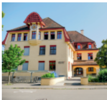
Das Schulhaus Reben 25 Archiv

Parallel zum Schulzentrum-Neubau «Lärche» plant die Sekundarschulgemeinde Arbon (SSGA) die Total-sanierung, räumliche Anpassung und neue Aussenraumgestaltung des Schulzentrums Reben 25. Das Planerwahlverfahren für den Projektwettbewerb wird jetzt gestartet.