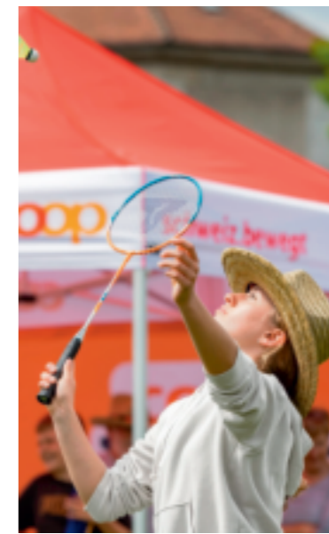
Auch Badminton-Minuten zählen.

Dabei sammelt die Bevölkerung Bewegungsminuten. Je mehr sich die Teilnehmenden bewegen, desto mehr Bewegungsminuten sammeln sie für Arbon – unabhängig von Alter, Ort oder Bewegungsart. Zum Sammeln der Bewegungsminuten gibt es zwei Möglichkeiten: Einerseits finden vom 1. bis 31. Mai in Arbon diverse Bewegungsaktivitäten wie zum Beispiel Fussball, Yoga, Badminton oder eine Altstadtout statt und alle sind eingeladen, an den kostenlosen Angeboten teilzunehmen. Das Bewegungsprogramm ist unter www.coop-gemeindeduell.ch aufgeschaltet. Andererseits können über den persönlichen Coop Gemeinde Duell-Account vom 1. bis 31. Mai individuell